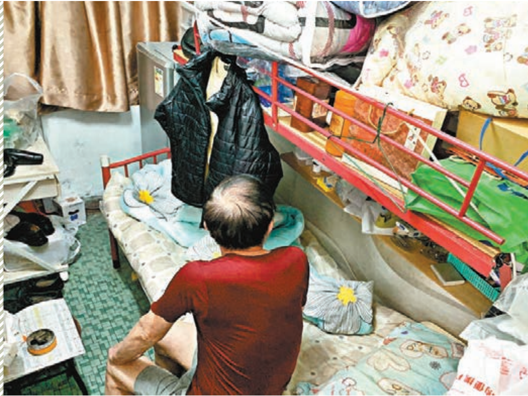
公屋輪候時間增至近六年，已非劏房戶咬緊牙關便可捱到的時間。