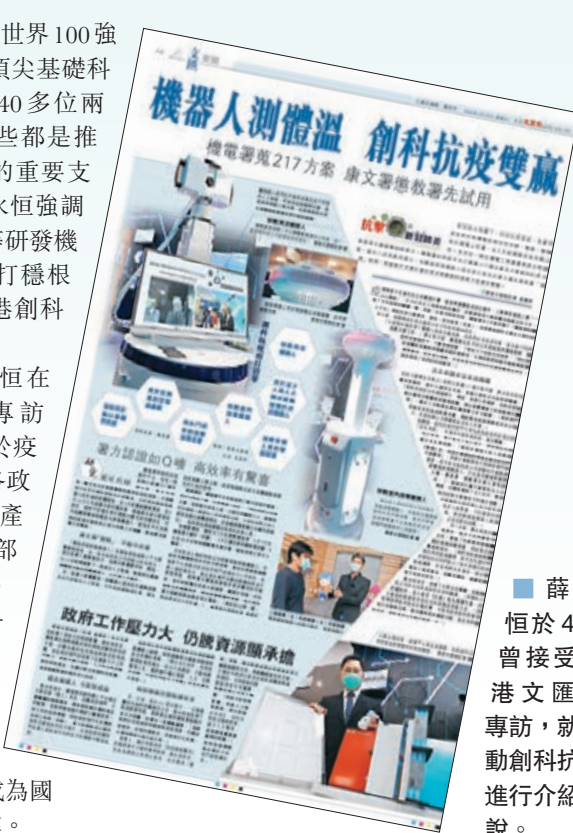
薛永恒於4月曾接受香港文匯報專訪，就推動創科防疫進行介紹解說。