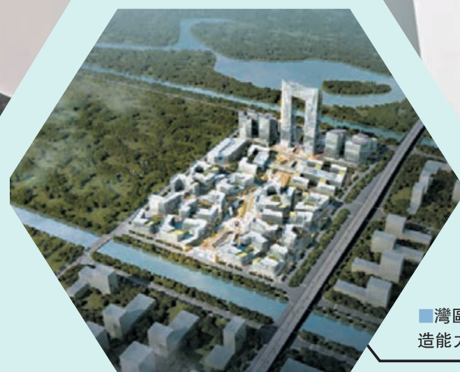
灣區擁有龐大市場，亦具備科研成果轉化和先進製造能力。圖為灣區精準醫學產業基地俯瞰設計圖。