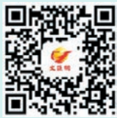
薛永恒訪問 短片二維碼