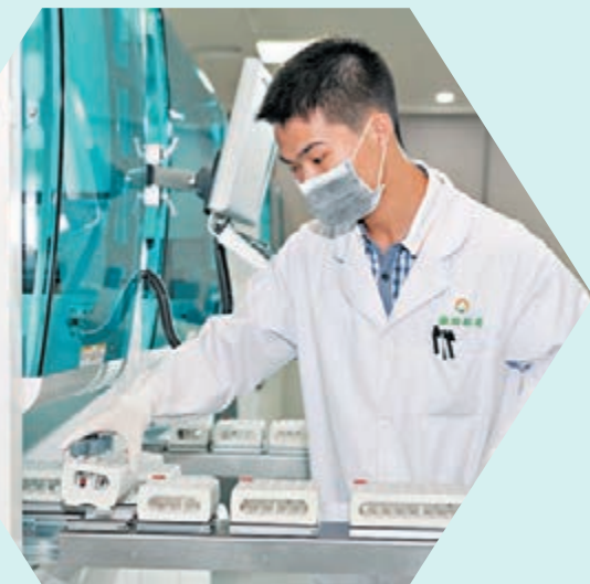
香港與灣區優勢互補，實現人才、資訊、資金互通的藍圖。圖為灣區醫檢與生物科技合作項目。