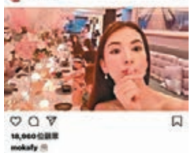
方媛間中亦有相約一班姊妹敘舊。