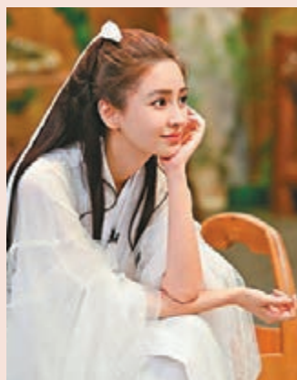
Angelababy古裝打扮，依然美麗動人。

據悉，Angelababy工作室在6月30日公布Baby7月行程，原定4日要在深圳錄製綜藝節目，但3日上午臨時宣布取消，令不少粉絲感到氣憤失落。不過，有粉絲也出面呼籲大家不必猜測Angelababy發文原因，更不要攻擊小孩。