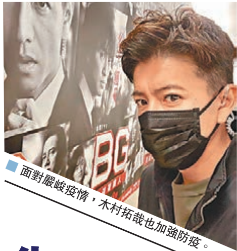
面對嚴峻疫情，木村拓哉也加強防疫。

尊尼事務所是全日本知名演藝經理人公司，被稱為日本第一「男偶像製造所」，旗下紅星有木村拓哉、山下智久；男團有早期的TOKIO、V6、KinKi Kids、關西尊尼8、KAT-TUN、Kis-My-Ft2以及近期的SixTONES、Snow Man、King & Prince等。其中瀧澤秀明引退後擔任副社長，專心培養尊尼藝人。不過，新冠病毒連紅星都「無面界」，尊尼事務所藝人也「中招」！