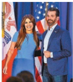
■ 小特朗普(右)與女友吉伊福伊爾。