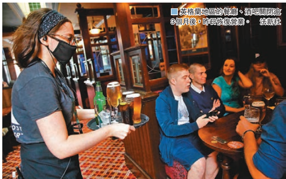
■ 英格蘭地區的餐廳、酒吧關閉逾3個月後，昨日恢復營業。法新社

英國的新冠疫情累計逾4.4萬人死亡，居歐洲之冠，但感染率與病發人數近期呈下降趨勢，從3月23日起實施的禁令正逐步解