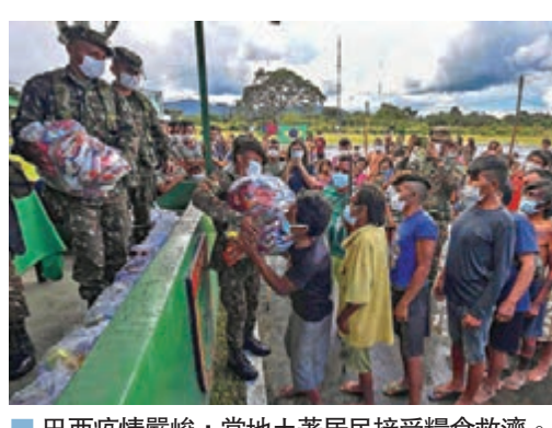
■ 巴西疫情嚴峻，當地土著居民接受糧食救濟。

在談到美洲地區疫情時，瑞安指出，儘管感染和死亡人數激增，但太多國家無視數據，「這些國家有充分理由需要恢復經濟。這可以理解，但同樣不能無視疫情問題。這問題並不會神奇地消失。」瑞安警告若繼續重啟，但應對疫情的工作卻跟不上，最終會出現「最糟糕的情況」，一旦衛生系統崩潰，將有更多人死亡，認為一些國家有必要放慢或改變部分解封措施。