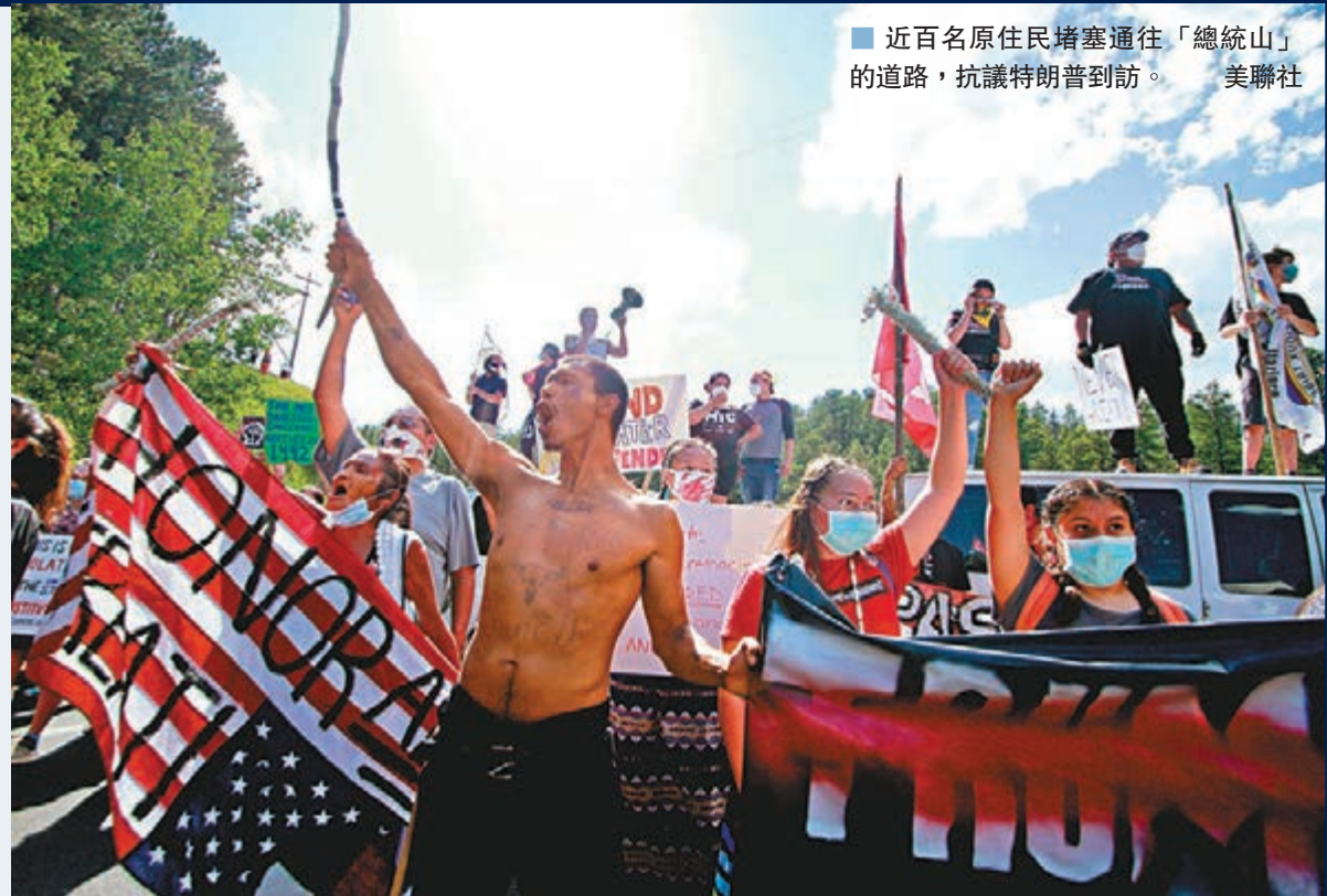
■ 近百名原住民堵塞通往「總統山」的道路，抗議特朗普到訪。