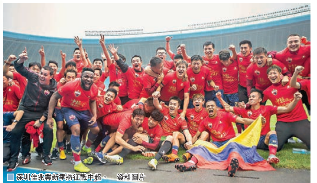
深圳佳兆業新季將征戰中超。資料圖片

中國足協表示，中超球會需要在7月10日前完成不涉及轉會球員的註冊，7月24日前完成涉及轉會的球員註冊。如有特殊原因，可以在7月24日至29日申請辦理註冊，但累計不得超過5人次。 ■新華社