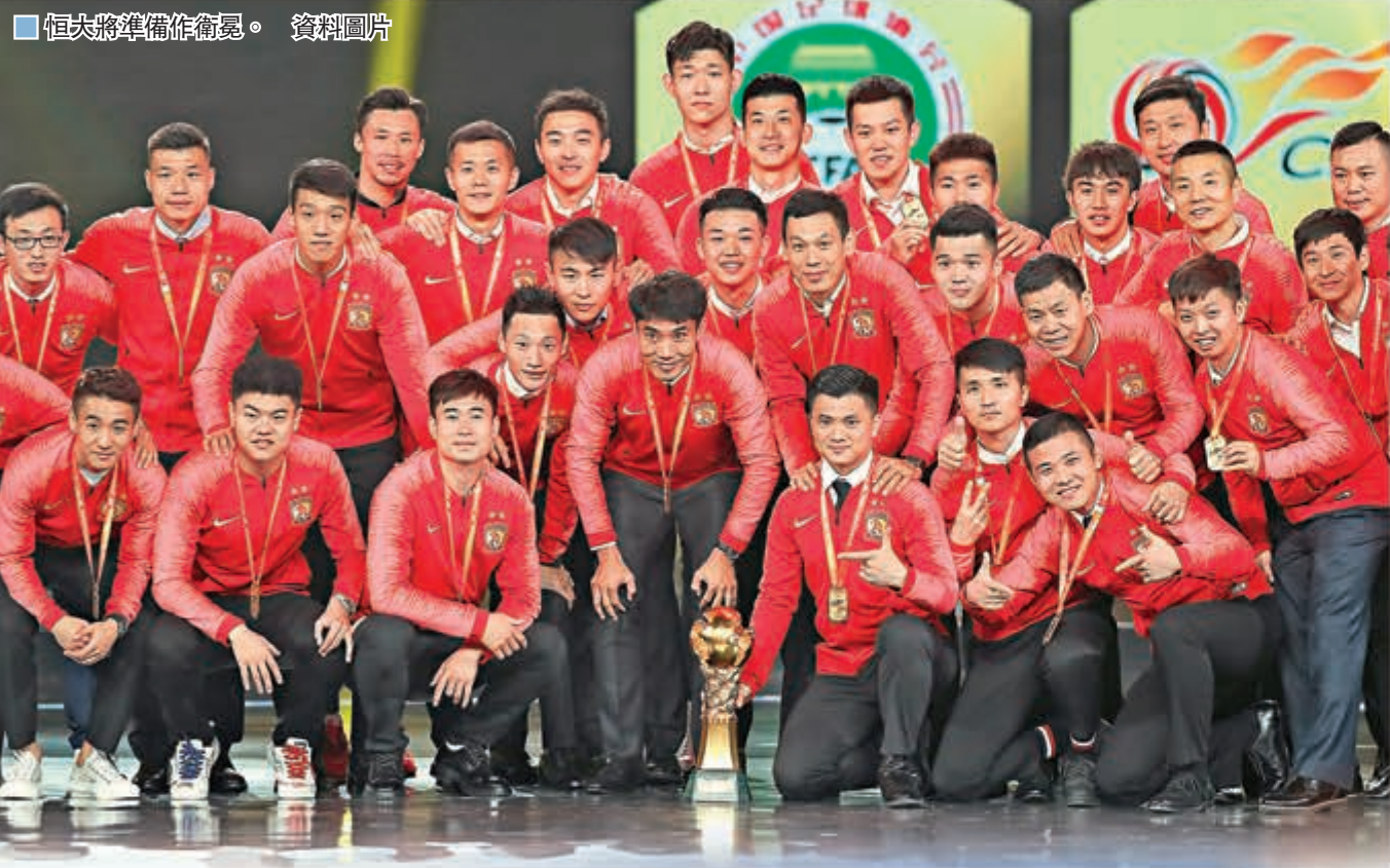
恒大將準備作衛冕。資料圖片

備受矚目的中超聯賽重啟終於「塵埃落定」。中國足球協會於昨日發布公告稱，2020中超聯賽將於7月25日分別在蘇州賽區和大連賽區舉行。