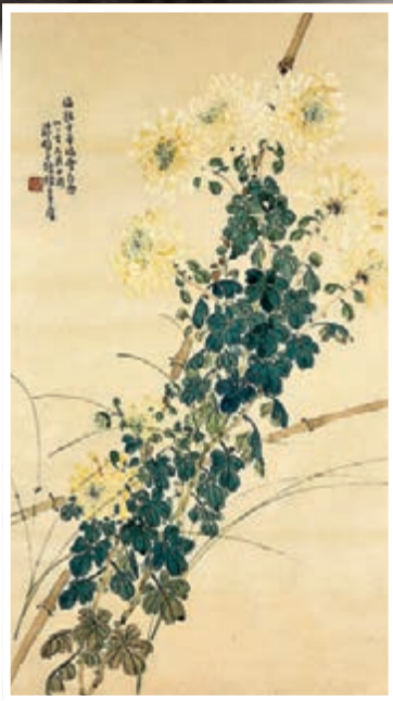
陳樹人作品《東籬秋色》。