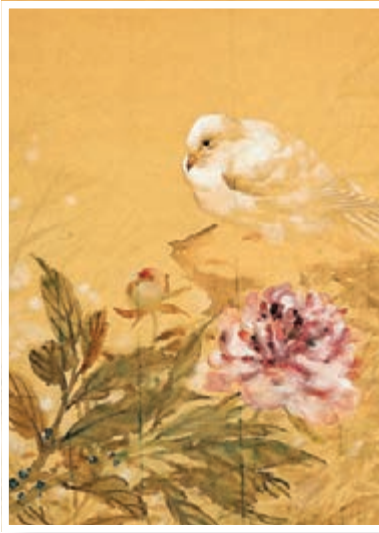
費成武作品《芍藥白鴿》。