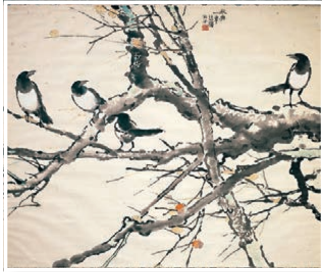
徐悲鴻作品《秋興圖》。