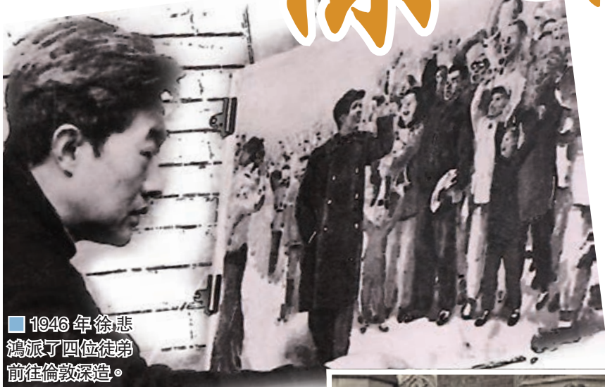
1946年徐悲鴻派了四位徒弟前往倫敦深造。