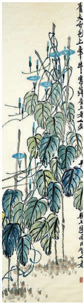
齊白石作品《青天牛犇》。