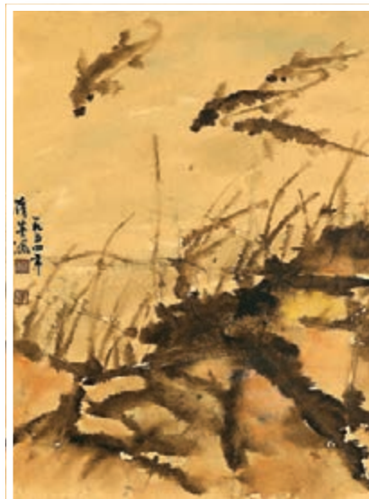
張蓓英作品《魚趣圖》。