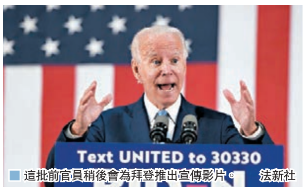
■ 這批前官員稍後會為拜登推出宣傳影片。法新社

2004年布什競選連任團隊幕僚米利金是委員會成員之一，他表示特朗普種種施政措施極度有違常理，「總統自己便是一個危險」。布什時期白宮傳訊職員珀塞爾強調參與者是「為國家而非政黨投票」，相信拜登領導的政府能夠遵守法治，維護白宮的尊嚴與完整。