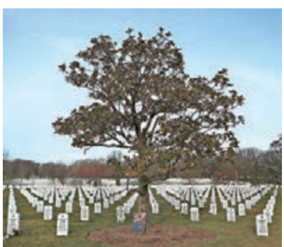
■ 俄羅斯被指向塔利班提供賞金，誘使他們殺死美軍。圖為殉職美軍墓地。資料圖片

俄羅斯駐美大使安東諾夫前日重申，有關懸賞的報道純屬謊話，目的是破壞美俄合作，批評個別美國媒體在沒有提出任何證據下抹黑俄羅斯。他又表示，俄羅斯大使館已經要求美國國務院，調查社交網站上有人就此事威脅對俄羅斯外交官不利的事件。白宮方面周一曾稱特朗普對情報不知情，並解釋相關情報尚未核實，故