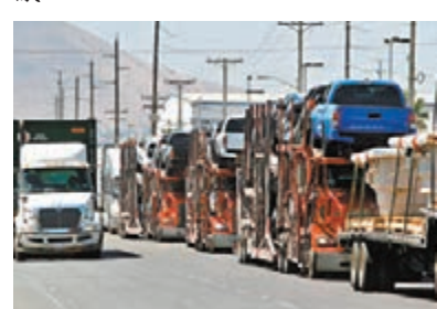
■ 3國貿易額跌至10年來最低水平。圖為美墨邊境。

美國、加拿大和墨西哥的《美墨加貿易協定》(USMCA)昨日正式生效，不過協定生效之時正值新冠疫情下，3國之間貿易額跌至10年來最低水平之際，加上美國總統特朗普正威脅對加拿大徵收鋁關稅，墨西哥勞動法改革亦可能觸礁，未來3國之間可能因為新協定出現更多爭議。