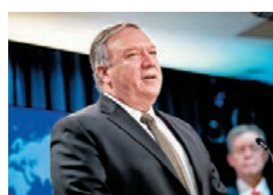
■ 蓬佩奧期望塔利班履行承諾。

塔利班則說，巴拉達告訴蓬佩奧，塔利班「不允許任何人在阿富汗的領土上攻擊美國與其他國家」。塔利班發言人引述蓬佩奧的談話指出，蓬佩奧知道塔利班根據協議不會攻擊市中心與軍事基地，但他呼籲塔利班採取更多行動降低整體暴力衝突。塔利班在上月提議開齋節短暫停