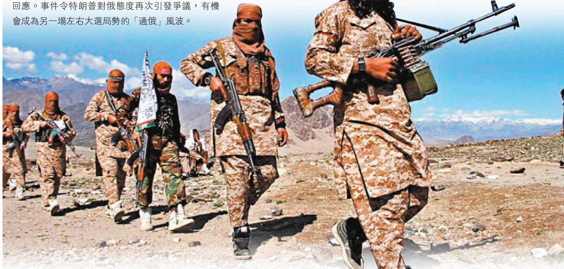
■ 俄羅斯軍情部門被指曾向與塔利班有聯繫的銀行賬戶轉入大筆金額。圖為塔利班分子。

俄羅斯被指曾向阿富汗塔利班懸紅殺死美國軍人一事，繼續在美國政界發酵，白宮前日一度改口承認，總統特朗普的確曾閱讀過相關情報，甚至稱總統是「地球上知得最多的人」；民主黨議員前日就事件在白宮聽取報告後，指出特朗普一定知悉俄羅斯有嫌疑，卻沒有採取任何行動回應。事件令特朗普對俄態度再次引發爭議，有機會成為另一場左右大選局勢的「通俄」風波。