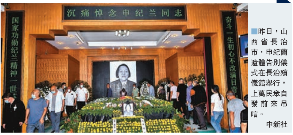
昨日，山西省長治市，申紀蘭遺體告別儀式在長治殯儀館舉行，上萬民眾自發前來弔唁。

上午8時30分，弔唁者陸續進入。容納了100多人的怡然廳內哀樂聲聲。申紀蘭的遺像面露微笑，音容宛在。電子屏上寫着「沉痛悼念申紀蘭同志，奮鬥一生初心不改滿目青山化豐碑，國家功勳紀蘭精神一世英名貫長虹」。靈堂中央，棺木上覆蓋着黨旗，白色花園環繞周圍。上午9時，申紀蘭遺體告別儀式開始。