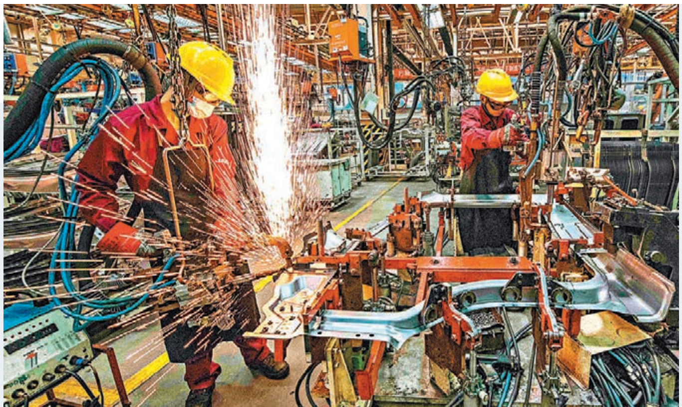
昨日，中國國家統計局服務業調查中心、中國物流與採購聯合會發布的數據顯示，上月製造業PMI為50.9%，比5月份上升0.3個百分點。圖為工人昨日在山東省青州市一家汽車製造企業的沖焊車間內生產作業。

隨着PMI等先行指標向好，市場普遍預計，6月份主要經濟指標繼續改善，並助推二季度經濟恢復增長。渣打銀行大中華區及北亞區首席經濟學家丁爽最新預測，6月份消費增速有望轉正，支撐二季度中國經濟增速達到3%左右。但外需恢復緩慢、就業壓力較大，制約下半年經濟復甦。