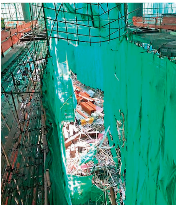
地盤棚架被工字鐵擊中塌下。