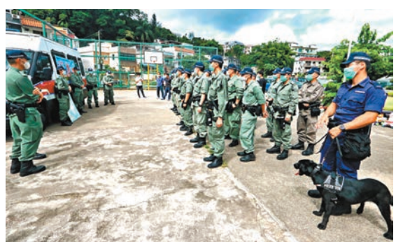
前日警方聯同政府飛行服務隊在將軍澳及西貢一帶展開「海陸空」反爆竊行動。

警方在營地附近通宵埋伏監視，但未見可疑人出現。直至昨晨10時許，警方聯同漁護署人員到現場搜證，檢獲8公斤沉香木，市值約60萬元，人員檢走沉香木及一干證物