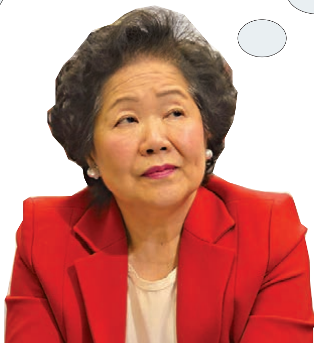
■陳方安生 資料圖片

現年80歲的陳方安生曾是香港政府主要官員，1962年於香港大學畢業後加入政府，1993年至1997年出任香港首位華人布政司。1997年回歸後擔任政務司長，並在2001年以私人理由提早退休。她退休後仍活躍於香港政壇，包括2007年參與七一遊行，近年更多次赴美會面美國官員，高調談論香港狀況，及在修例風波期間多次參與反對修例的遊行。