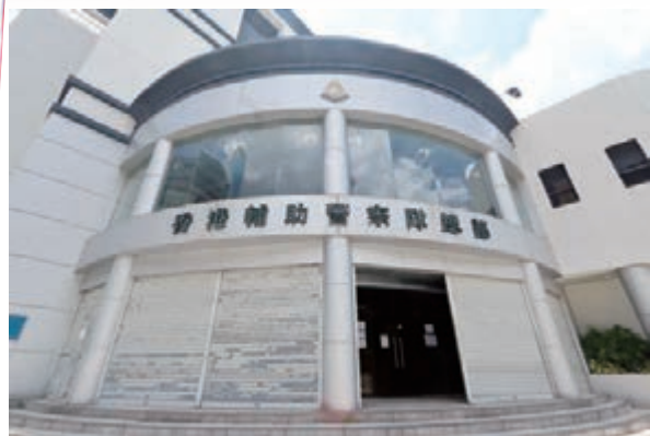
九龍灣輔警總部。