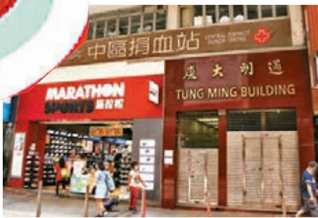
中區捐血站。

醫管局其後轉由紅會輸血服務中心回覆香港文匯報，但沒有正面回應上述問題，只稱中心日前舉行血液收集活動時，其中一位員工服務態度未如理想引致部分捐血者不安，中心職員已經即時處理，其後活動單位經商議後決定暫停是次活動，中心對是次事件引起的誤會致歉。該中心表示會跟進事件，並重申醫護人員會恪守一視同仁原則，以提供專業服務，為病人提供足夠血液，保障捐血者及血液安全。