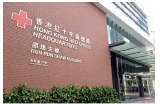
紅十字會總部。