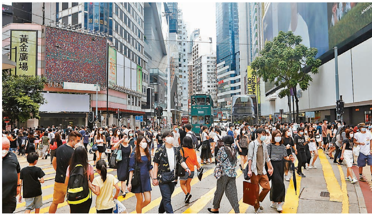
林鄭月娥強調，經此一「疫」，市民更應該珍惜，聚焦重振經濟、改善就業。圖為銅鑼灣街景。

她強調，「中央今次由國家層面為香港特區維護國家安全立法是要堵塞法律制度和執行機制的漏洞，讓香港社會早日恢復安寧，國家安全得到更大的保障，這是香港特區維護國家安全的憲制責任，也是包括港人在內的全國人民的共同義務。」