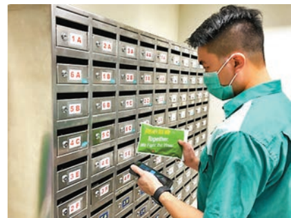
香港郵政會由下星期二開始陸續向全港住宅地址派送口罩。