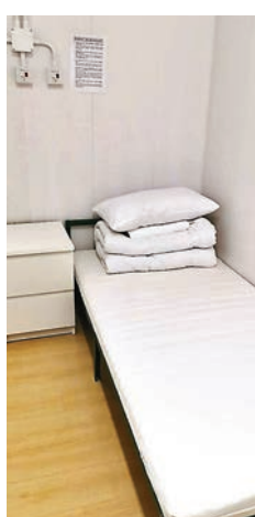
除一名滯留者已飛返迪拜外，其餘10人被送往檢疫中心隔離14天。