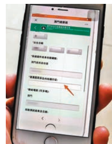
澳門預料三地健康碼7月或有好消息。圖為澳門健康碼。資料圖片

香港文匯報訊(記者 文森)香港及廣東省有望率先推出健康碼互認制度，讓持有有效健康碼的出入境人士毋須隔離檢疫14天，該制度之後將涵蓋澳門。澳門行政長官賀一誠昨日透露，7月或有好消息。他表示，港澳兩地的技術部門近期進行測試，運作基本良好。澳門很快可以把病毒陰性檢測結果上載到健康碼，比內地還要快，希望香港可同步跟上。