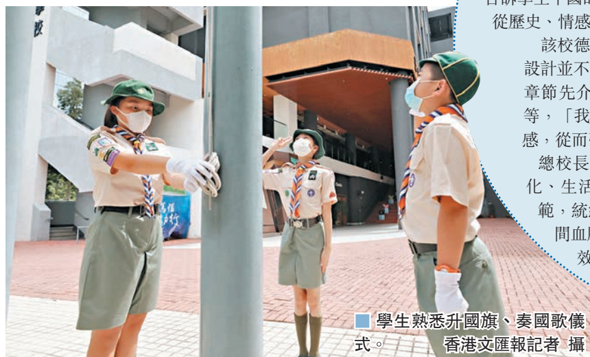
學生熟識升國旗、奏國歌儀式。

該校一直有於校內升掛國旗區旗及奏唱國歌的傳統，除了元旦、國慶、回歸紀念日等重要日子，學校亦會在開學日、畢業禮、水陸連會等升掛國旗、區旗，學生亦要在升旗儀式中配合奏唱國歌、校歌。