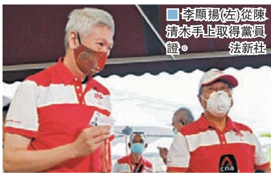
李顯揚(左)從陳清木手上取得黨員證。

新加坡總理李顯龍前日宣布解散國會，並提早於下月10日舉行大選，一直與李顯龍不和的胞弟李顯揚昨日公開露面，宣布已加入在野的新加坡前進黨。對於會否參與本屆大選，李顯揚表示會在作好準備後才公布計劃，並稱可以通過很多方式，為前進黨作出貢獻。觀察家認為，前進黨不可能動搖人民行動黨的執政地位，但李顯揚加入前進黨，與兄長「打對台」，有機會吸走人民行動黨部分選票。