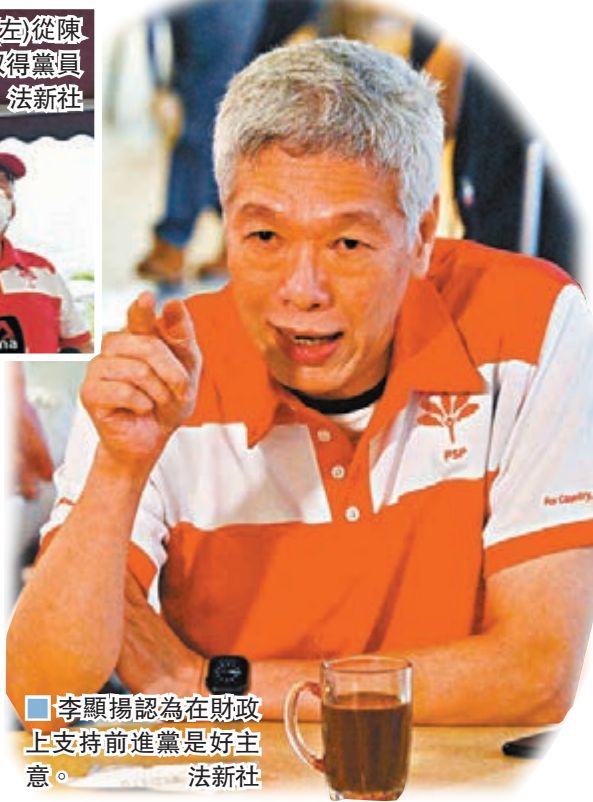
李顯揚認為在財政上支持前進黨是好主意。