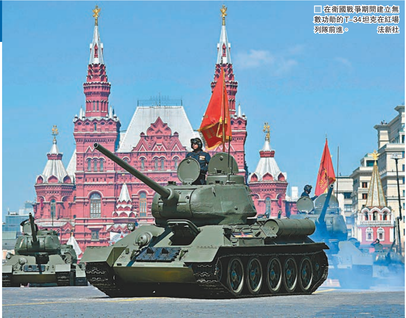
在衛國戰爭期間建立無數功勳的T-34坦克在紅場列隊前進。