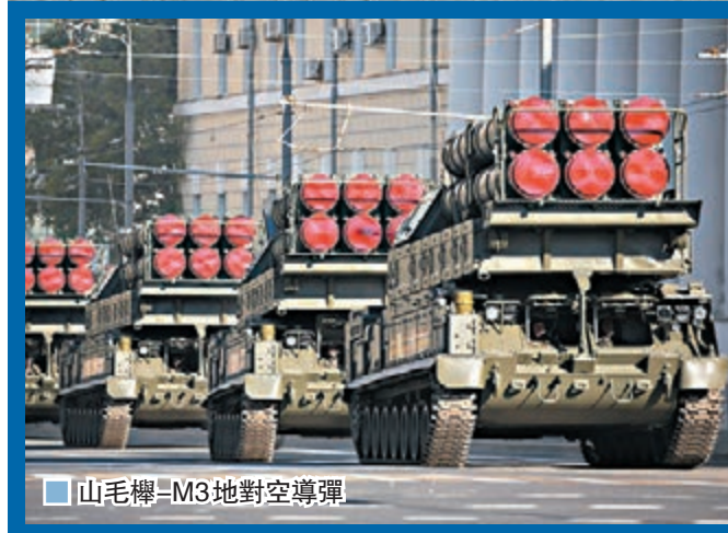
山毛櫸-M3地對空導彈