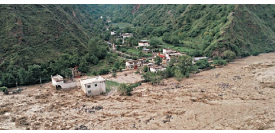
6月17日,四川省丹巴縣的民房被土石流淹沒,當地緊急疏散居民2萬餘人。

香港文匯報訊 綜合記者孟冰及中新社報道,近一周來,重慶十三個區縣大到暴雨。受強降雨影響,長江上游支流、綦江重慶段22日遭遇1998年以來最大規模洪水。洪峰過境綦江城區時,水位達227.6m,超保證水位5.1m。重慶市綦江區發生城市內澇,部分地區水位超1998年的「98洪災」,發生1951年建站以來最大洪水。截至發稿時,洪澇災害已造成重慶21萬人受災,11.1萬人轉移避險,近1,900人需緊急生活救助,200餘間房屋倒塌,農作物受災面積7.3千公頃,直接經濟損失2.1億元人民幣。