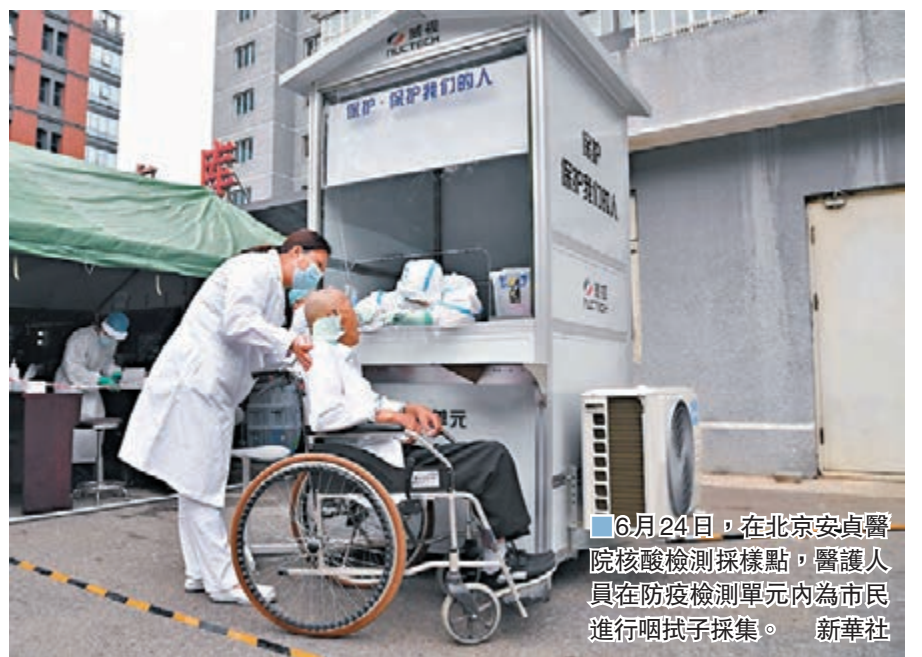
6月24日,在北京安貞醫院核酸檢測採樣點,醫護人員在防疫檢測單元內為市民進行咽拭子採集。

據介紹,截至6月22日,全國醫療衛生機構進行核酸檢測的累計數據達到9,041萬人份。從以上數據可以看到,中國核酸檢測能力得到大幅度提升。