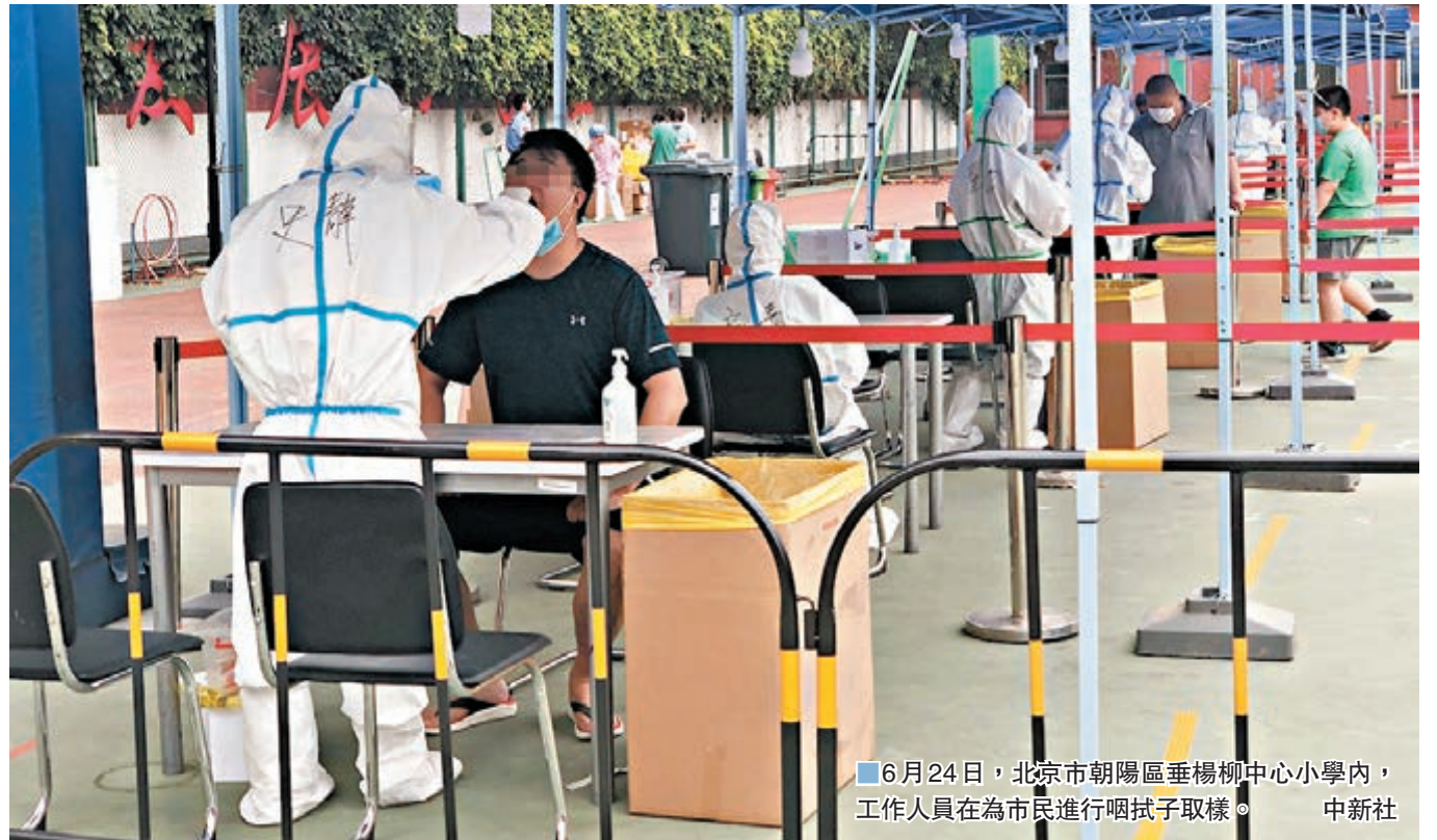
6月24日,北京市朝陽區垂楊柳中心小學內,工作人員在為市民進行咽拭子取樣。