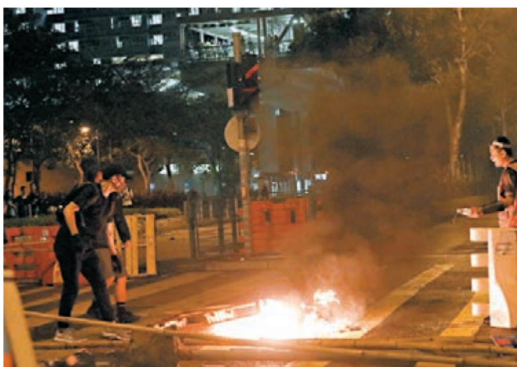
去年10月13日入夜，將軍澳站有暴徒攔圍封爛玻璃的鐵皮。