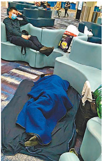
九人被逼睡在機場，部分人身上現金不足，連吃飯都有困難。