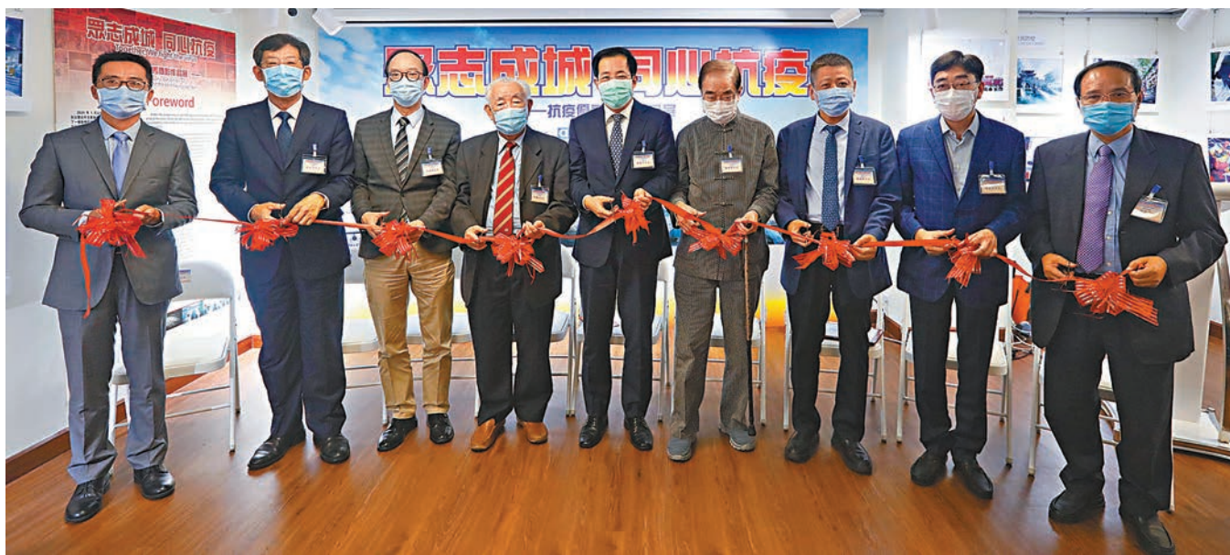
「眾志成城 同心抗疫——抗疫優秀攝影作品展」昨開幕，嘉賓剪綵。

香港文匯報訊（記者 子京）新型冠狀病毒疫情雖令中國以至全球蒙受損害，但也連結了民眾的抗疫之心。《中國日報》與藝術香港由昨日起聯合主辦「眾志成城 同心抗疫——抗疫優秀攝影作品展」，展出由全國徵集的逾百幅與抗疫相關的攝影作品，當中逾80幅來自內地並以武漢抗擊為主，其餘則是關於香港的抗擊故事，還原國家與香港抗擊之路的艱辛歷程與感動時刻，展期至下月2日止。