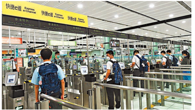
落馬洲口岸也將配合港版健康碼的推行，最快下周初重開。資料圖片

據悉，港版健康碼流程簡單，市民可先到政府公布的八間私家醫院或化驗所登記，並接受醫生臨床問症或提交醫生轉介信，然後拿取樣本收集瓶，於翌日早上起床後，在刷牙漱口及飲食前，自行採集深喉唾液樣本，之後將樣本交回醫院或化驗中心。一般而言，早上交回樣本，下午會有結果。