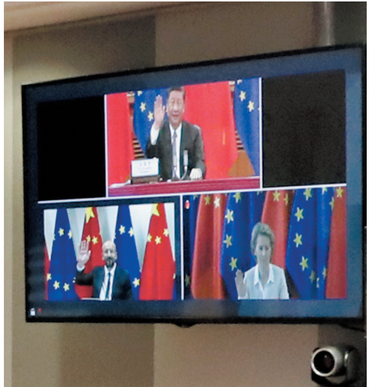
■ 習近平昨晚在北京以視頻方式會見歐洲理事會主席米歇爾和歐盟委員會主席馮德萊恩。

習近平強調，中國既是擁有悠久歷史的古老國度，又是充滿活力的發展中國家。中國要和平不要霸權。我們一切政策和工作的出發點就是讓中國人民過上幸福生活。我們將沿着和平發展道路堅定不移走下去。中國是機遇不是威脅。中國將繼續深化改革、擴大開放，這將為歐洲提供新一輪合作機遇和發展空間。中國是夥伴不是對手。中歐沒有根本利害衝突，合作遠大於競爭，共識遠大於分歧。雙方要相互尊重、求同存異、和而不同，不斷增進彼此理解和信任，在合作中擴大共同利益，在發展中破解難題，打造更具世界影響力的中歐全面戰略夥伴關係。