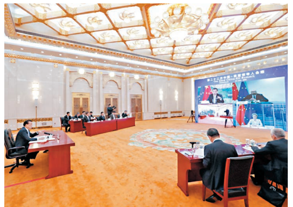
■ 中國—歐盟領導人會晤重申致力於2020年達成中歐投資協定。圖為李克強主持會議。

米歇爾和馮德萊恩表示，在抗擊疫情過程中，歐中相互支持緩解防疫、疫情對各國帶來的衝擊，歐中合作的意願沒有減弱，歐方願同中方加強經濟復甦合作，共同維護產業鏈、供應鏈安全，進一步擴大市場開放，深化在經貿組織改革、氣候變化問題上的合作，共同維護多邊主義和自由貿易。 王毅、何立峰等出席會晤。