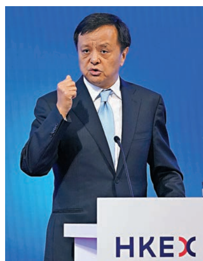
李小加相信，在港區國安法下，香港仍會是內地最自由、國際化、開放的市場。資料圖片

他指，香港是中國最重要的國際資本市場之一，香港也是美國等西方國家在亞洲最重要的國際金融市場。「無論美國做什麼，它都不會改變一個事實：香港仍然會是中國最國際化、最開放的市場。這樣的香港符合中國的利益，符合美國的利益，符合世界的利益。」