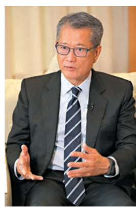
陳茂波認為，倘中美摩擦升溫，勢將令全球經濟復甦之路更艱難。資料圖片

在「一帶一路」建設方面，林鄭月娥表示，疫情穩定後，特區政府會組織商貿考察團到「一帶一路」地區進行推廣和加強與當地的直接聯繫，推動香港業界在境外經貿合作區開拓業務。此外，特區政府將於今年11月30日與貿發局合辦第五屆「一帶一路」高峰論壇，促進香港工商及專業服務界別與內地及世界各地的企業對接。