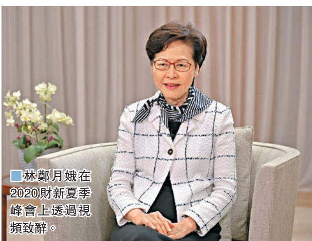
林鄭月娥在2020財新夏季峰會上透過視頻致辭。

去年下半年起出現的黑暴、「港獨」等問題嚴重滋擾香港社會發展，不少人都期望隨着港區國安法公布實施，可令香港重拾昔日繁榮。行政長官林鄭月娥昨日表示，制定港區國安法是香港重回「一國兩制」軌道，恢復憲制秩序，確保社會穩定，維持企業和個人對香港信心的重要舉措，是勢在必行，不容有失。「只要堅持和完善『一國兩制』的制度體系，嚴厲打擊危害國家安全的違法分子，止暴制亂，用好自己的優勢，香港仍然商機處處。」