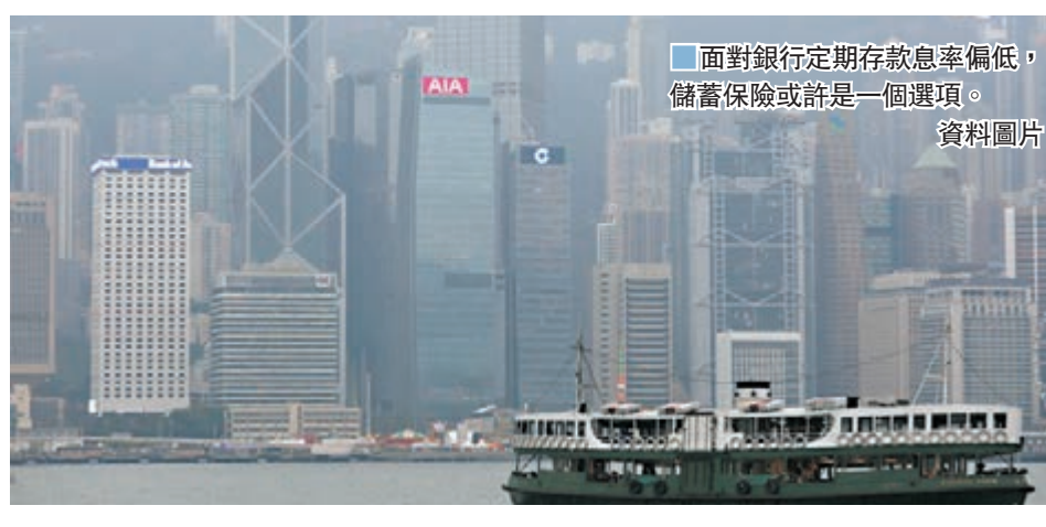
面對銀行定期存款息率偏低，儲蓄保險或許是一個選項。

至於計劃期滿一般為5年-6年。回報方面，此類產品提供保證回報，能助投保人穩健增值，因此可用來對抗通脹及分散資產組合的風險。除提供穩定回報外，儲蓄保險亦提供人壽保障，身故賠償一般為已繳保費的101%-110%。最後，投保申請毋須驗身，手續相對簡便，亦為其吸引之處。