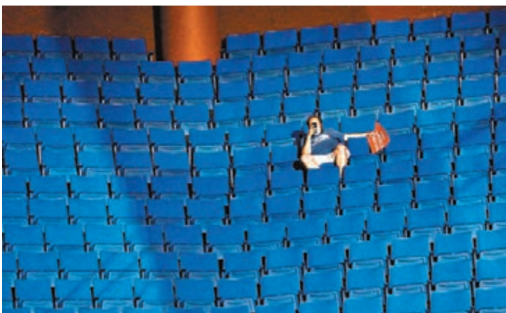
■會場空位眾多，有特朗普支持者索性走到上層找更佳角度拍攝。