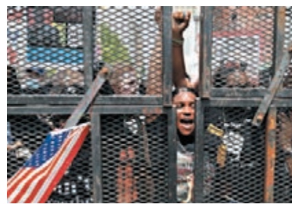
■示威者在場外叫口號。