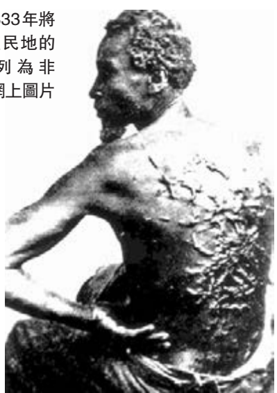
英國 1833 年將大部分殖民地的奴隸制列為非法。網上圖片

英國國會於 1833 年通過廢奴法案，將大部分殖民地的奴隸制列為非法，全面禁止蓄奴及奴隸貿易，並解放奴隸。為了推行廢奴措施及賠償因此蒙受「損失」的奴隸主或相關人士，英國政府當時一次過發行多達 2,000 萬英鎊(今 24 億英鎊，即約 230 億港元)國債，相當於當時英國政府全年總開支約 40%。由於金額過於龐大，這批債券一直到 1957 年才開始償還，並到 2015 年才完全還清。