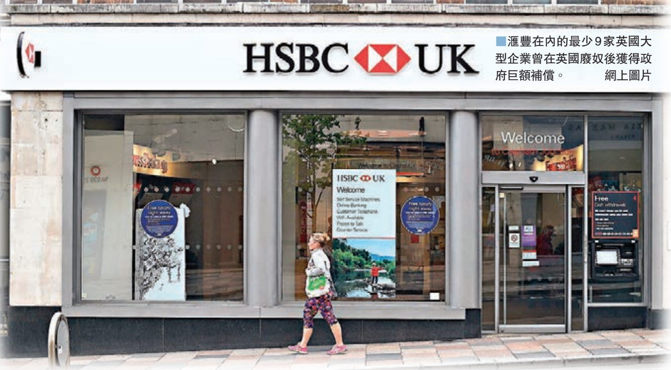
滙豐在內的最少 9 家英國大型企業曾在英國廢奴後獲得政府巨額補償。網上圖片