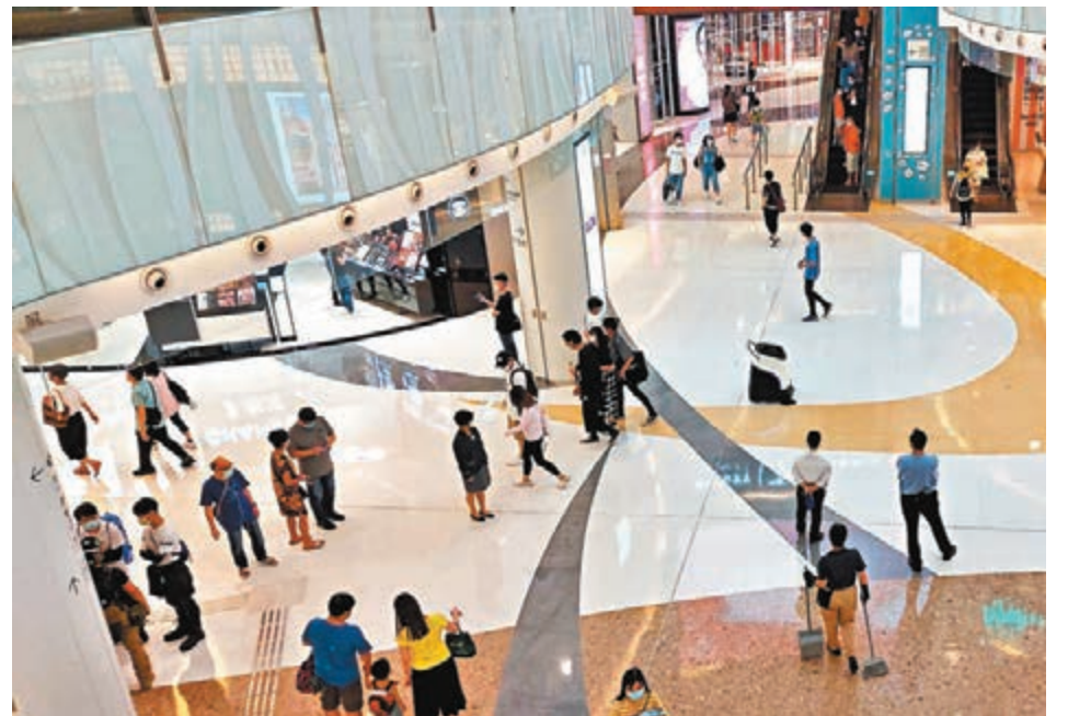
旺角新世紀廣場的搞事者下午4時半已陸續散去。