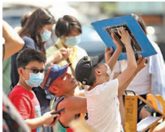
大人細路一齊睇日食。