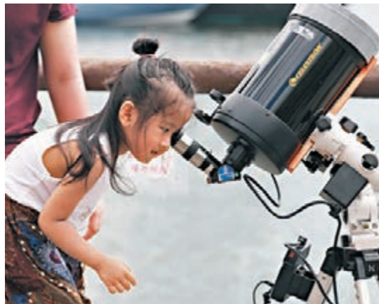
小女孩用望遠鏡睇日食。

香港文匯報訊（記者 文森）亞洲和非洲部分地區昨日可以觀測到日食的天文現象，而香港則於昨午看到日偏食情況，吸引大批市民觀看。今次日偏食多達89%的太陽直徑受月球阻擋，若錯過觀賞今次日食，下次更高食分的日食要50年後才會出現。