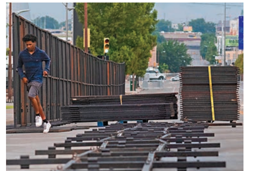
■ 場外設立圍欄,加強保安。

特朗普的造勢集會於塔爾薩俄克拉何馬銀行中心舉行,場地可容納1.9萬人,但因支持及反對特朗普的人士分別從全國各地湧至,塔爾薩市政府估計,當地有逾10萬人聚集。