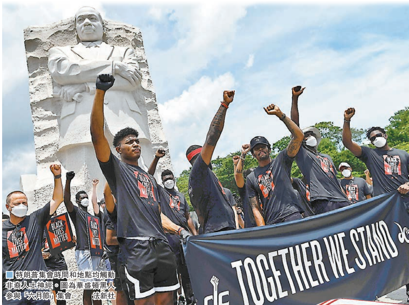
■ 特朗普集會時間和地點均觸動非裔人士神經。圖為華盛頓黑人參與「六月節」集會。

美國總統特朗普於當地時間昨晚7時(香港時間今晨8時),在俄克拉何馬州塔爾薩舉行疫情爆發以來首場競選集會。由於美國近期爆發反種族歧視示威,集會亦正值紀念黑奴解放的「六月節」翌日,塔爾薩在集會前夕氣氛緊張,前日已有不同政見人士聚集及口角,外界憂慮衝突一觸即發。