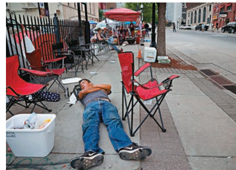
■ 支持者在集會場地外露營。

美國總統特朗普於當地時間昨晚7時(香港時間今晨8時),在俄克拉何馬州塔爾薩舉行疫情爆發以來首場競選集會。由於美國近期爆發反種族歧視示威,集會亦正值紀念黑奴解放的「六月節」翌日,塔爾薩在集會前夕氣氛緊張,前日已有不同政見人士聚集及口角,外界憂慮衝突一觸即發。