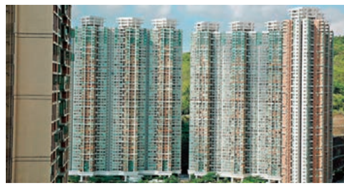
深圳福田區日前發布規範房地產中介的新規定，遏制二手房上漲和炒作。圖為福田區一處住宅小區。

福田區住建局同時表示，機構和人員違規違法情節嚴重、性質惡劣的，依法暫停涉事機構網簽權限。並將相關線索報區掃黑除惡辦。