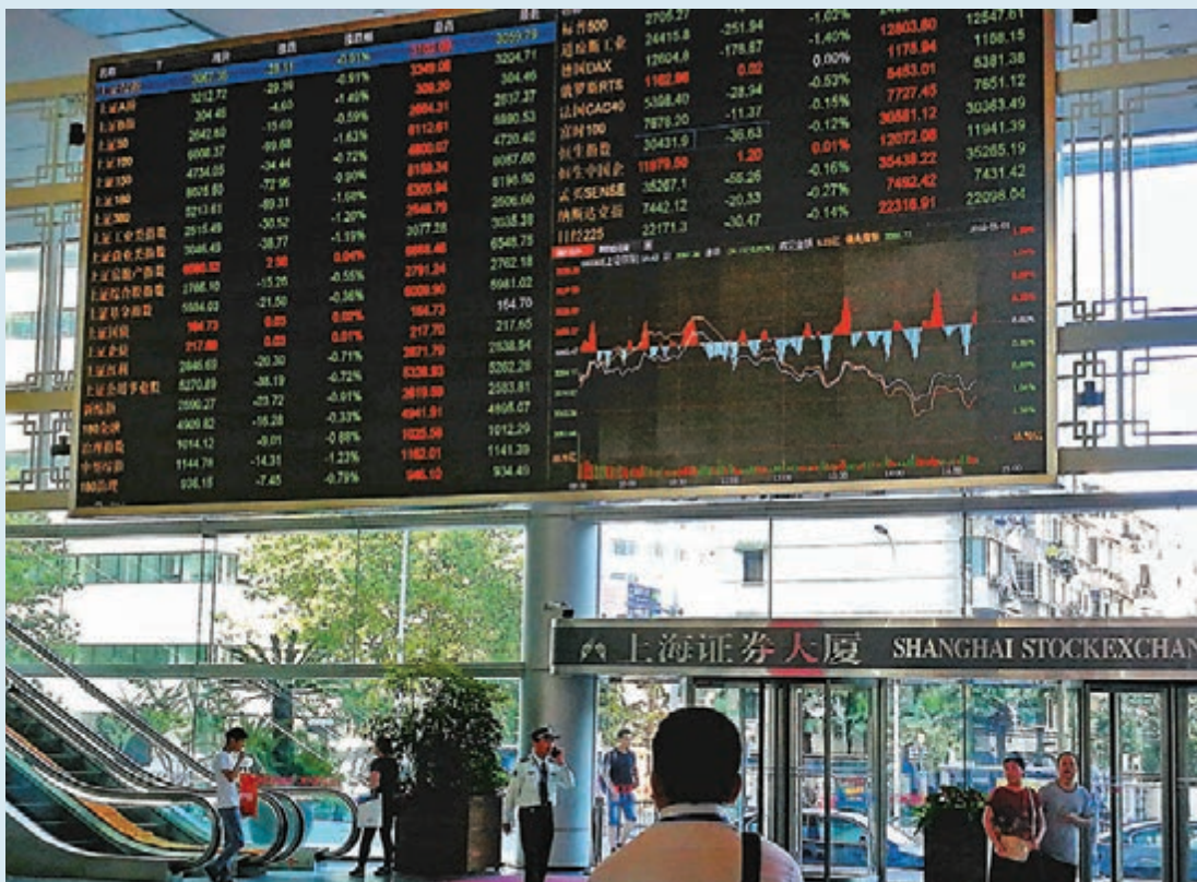
金融市場動作頻頻激發市場人氣，三大股指昨日一路走高。截至收市，滬綜指報2,967點，漲28點或0.96%。

A股在國際指數的擴容繼續，富時羅素(FTSE Russell)納A擴容料帶來30億美元增量資金，北向資金大幅淨流入超200億元(人民幣，下同)，加上陸家嘴金融論壇上金融高層集體力挺資本市場，滬深A股受鼓舞向上，三大指數齊升，創業板指大漲超2%，創下逾4年新高。上交所昨日收市後公布，7月22日修訂上證綜指的編制方案，納入科創板證券。