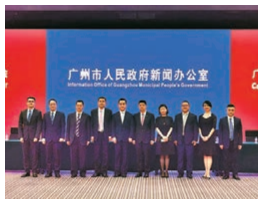
圖為廣州各銀行負責人出席廣交會新聞發布會。

此外，工行還與工銀亞洲密切合作，向工銀亞洲的500多家企業發出邀請，並積極溝通中華總商會、中華廠商會、香港中小企業商會、香港各界商會聯合會四家主流商會，邀請商會數萬家成員企業參與廣交會。如果電腦電子設備銷售商於近期通過工行發送的邀請鏈接順利註冊成為廣交會採購商，在體驗線上廣交會後，企業相關負責人表示，此次網上廣交會比往屆更便捷，公司可以瀏覽更多供應商和產品，且產品型號篩選、價格比較、付款方式選擇等方面更直觀、方便。在業務交流溝通方面也跨越了時間和空間的限制，很滿意這種新模式。據統計，截至6月18日，工行廣東分行成功邀請145家境外採購商參與本屆「雲端」廣交會，為參展企業帶來新訂單。