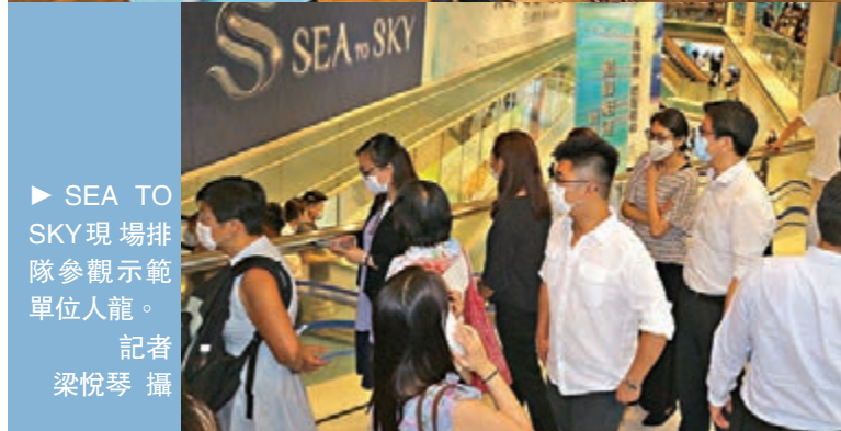
SEA TO SKY現場排隊參觀示範單位人龍。