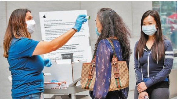
▲紐約蘋果店重開，為顧客量度體溫。