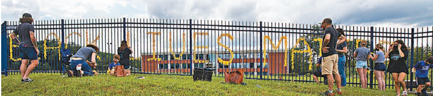
▲華盛頓有民眾在圍欄用紙條拼出「黑人的命也是命」字樣。