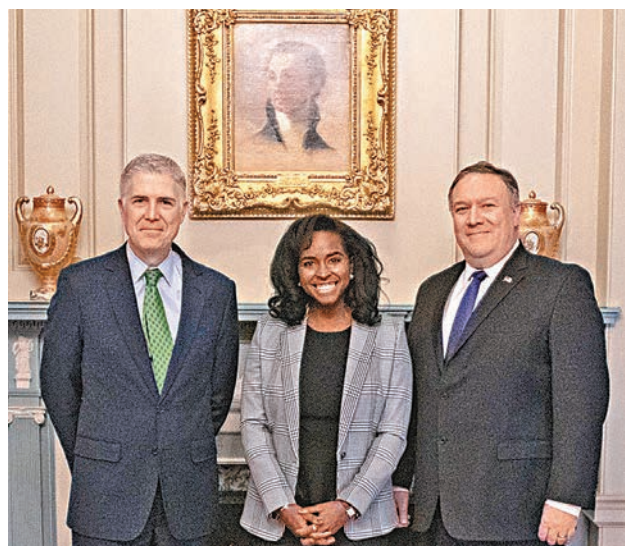
▲蓬佩奧至今仍拒絕就種族歧視議題，在國務院內部表態。左起為最高法院大法官戈薩奇，和泰勒與蓬佩奧。

泰勒在辭職信中特別感謝國務卿蓬佩奧，讚揚對方願意聆聽自己意見。不過美國有線新聞網絡(CNN)引述國務院職員指出，蓬佩奧至今仍拒絕就種族歧視議題，在國務院內部表態，使不少外交人員感到被遺棄，難以向外國交代美國示威，形容蓬佩奧的沉默對他們的工作構成直接影響。