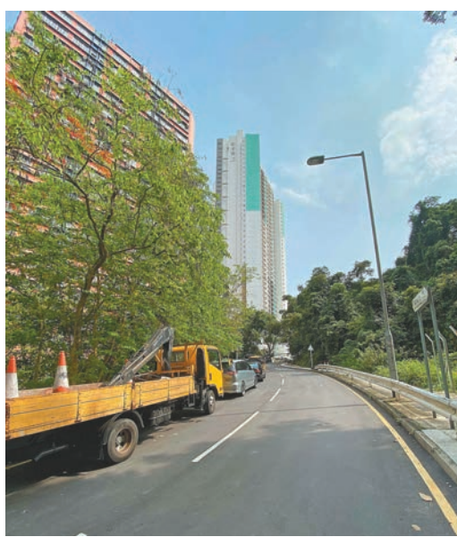
▲彩禾苑提供806個單位。▲前往彩禾苑須行經一條大斜路。