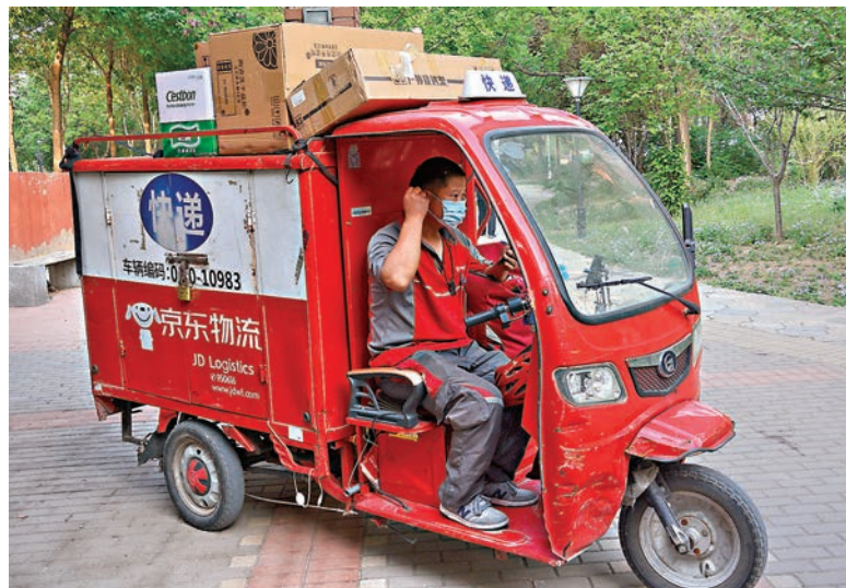
■京東今日上市，昨日暗盤價做好。

耀才暗盤則收報239元，較招股價升5.75%，最高曾見240元，每手賬面可賺650元；輝立暗盤收239.4元，同比增5.93%，每手賬面賺670元。