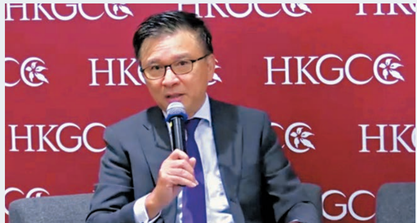
■陳家強相信，本港將繼續成為協助內地吸納外資的橋樑。

香港文匯報訊(記者 馬翠嫻)全國兩會對「十四五」之雛型已有明確規劃，WeLab虛擬銀行主席、前財經事務及庫務局局長陳家強昨出席一個論壇活動時表示，中國未來除了專注內需等，亦需要吸引更多外資大發展，而香港一直作為中國外商直接投資的主要來源地，他相信本港未來可以繼續善用所長，成為協助內地吸納外資的橋樑，並相信港地位難以取代。