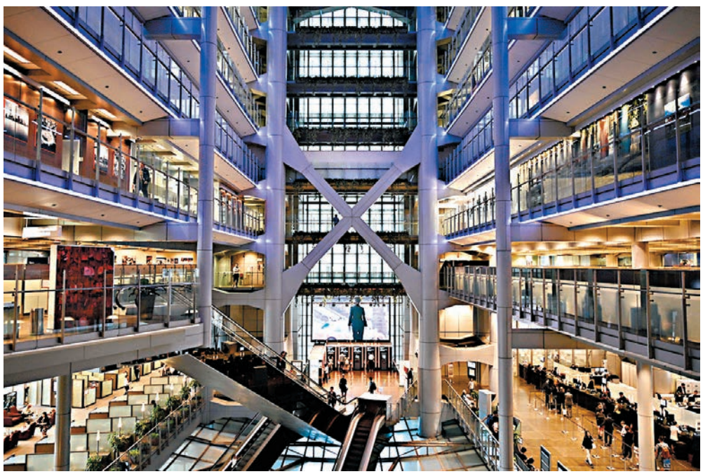
■滙豐在港僱員約3.1萬人，佔集團整體13%。