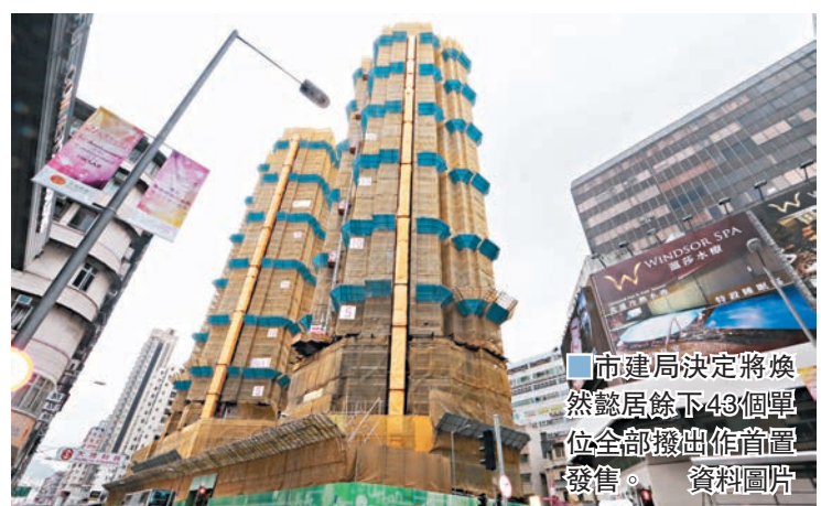
市建局決定將煥然懿居餘下43個單位全部撥作首置單位發售。