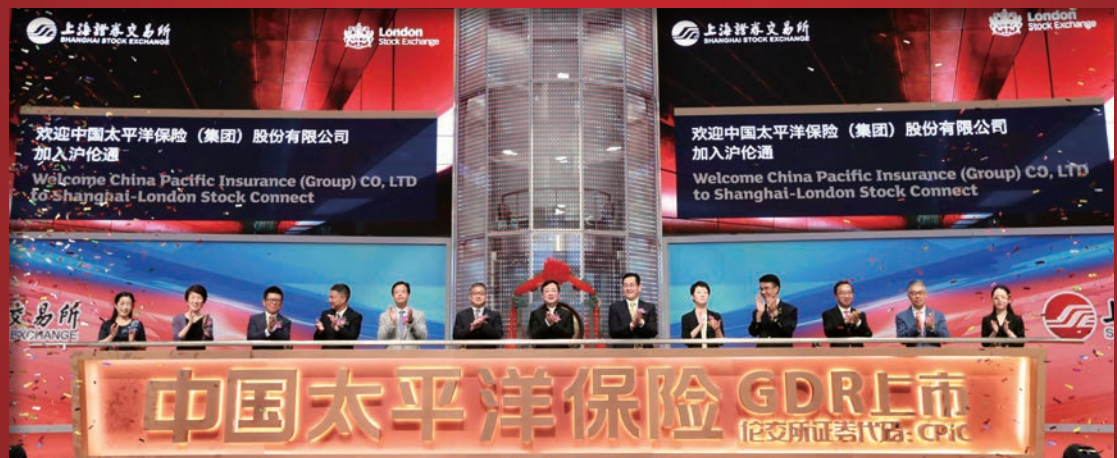
中國太平洋保險GDR在倫交所掛牌上市儀式現場

倫敦時間6月17日上午9時，中國太保滬倫通全球存託憑證(GDR)於倫敦證券交易所滬倫通板塊正式掛牌(證券代碼:CPIC)交易，發行定價為17.60美元，中國太保由此成為第一家在上海、香港、倫敦三地上市的中國保險企業。