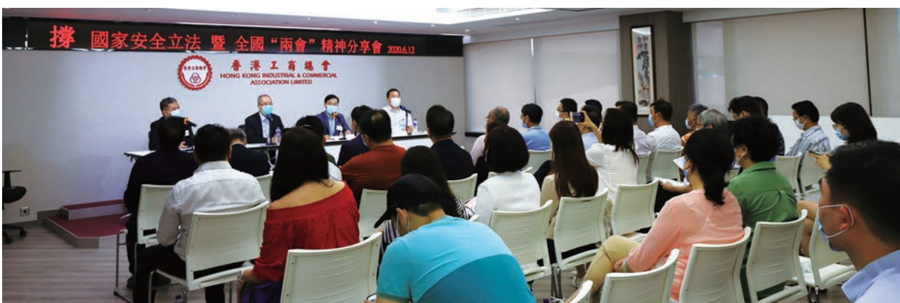
與會人員認真聆聽兩會精神分享