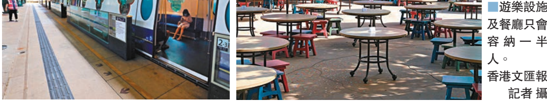
■遊樂設施及餐廳只會容納一半人。