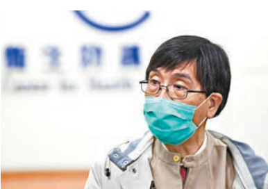
■袁國勇研雙檢測更準確發現病例。資料圖片

陽性反應，需要送院接受隔離治療，當中6人一直未有症狀，即67%患者沒有病徵。該9名確診者中，8人在核酸檢測及抗體檢測均呈陽性，餘下1人僅在抗體檢測呈陽性，經高分辨率CT（電腦掃描）證實確診。有關研究已於國際科學期刊《刺針傳染病期刊》發表。 團隊表示，無症狀患者會持續「放毒」，增加感染控制難度，亦有機會令個案突然大量急增，因此建議應結合核酸測試及血清檢測兩種方法，以準確找出感染者，盡早診斷、隔離和治療。