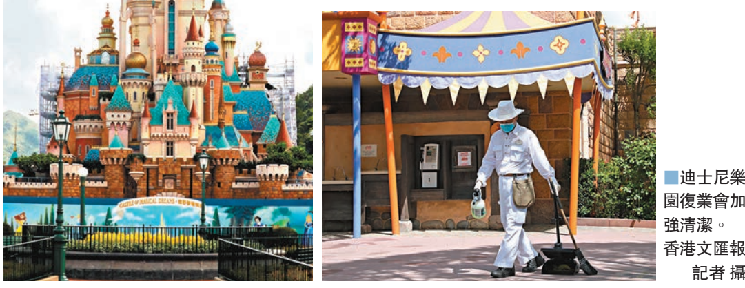
■迪士尼樂園復業會加強清潔。