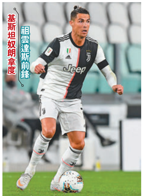
祖雲達斯前鋒 基斯坦奴朗拿度

拿波里在3日前的意大利盃4強次回合比賽僅和國際米蘭，由於賽會的安排，令他們較「祖記」少了一天的休息時間，這對一支長期沒有比賽的球隊而言可能影響頗大，因球員目前狀態還在初起階段，球員身體還未完全進入頂峰狀態，故就算球隊沒有傷停問題，在考慮到休息時間下，還是應投「祖記」信心一票。