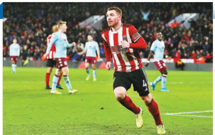
錫菲聯首循環輕取維拉。

錫菲聯目前排聯賽第7位，僅落後第4位車路士5分，仍有出席來季歐聯機會。在聯賽停擺前，錫菲聯球員其實曾予人體能有所下滑感覺，但經過3個月時間休息，相信錫菲聯眾將體力已完全恢復，是役有力於賴斯莫薩特和約翰費歷克等帶領下全取3分。