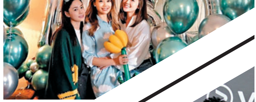
祖兒與Twins姐妹情深，一切盡在不言中。