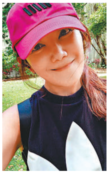
梁靜茹離婚後，依然活得自在。