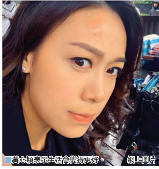
黃心穎表示生活會變得更好。