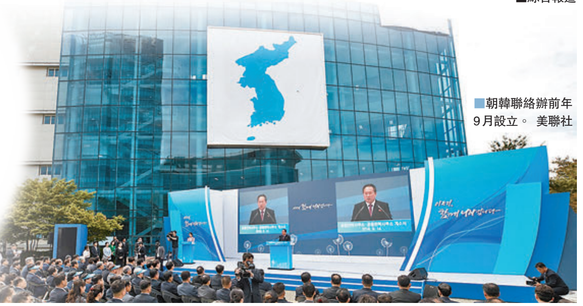
朝韓聯絡辦前年9月設立。