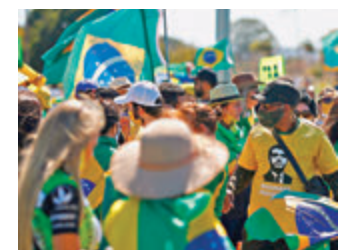
巴西總統博爾索納羅的支持者違反州府限聚令，在軍方總部外示威。

隨著美國各州份逐漸進入第二甚至第三階段重啟經濟活動，多州疫情出現反彈。過去一周有18州的新增病例上升，其中6州增加超過50%。最早重啟的佐治亞州、得州、佛羅里達州的新增確診及住院人數都上升，成為疫情「新熱點」。華盛頓大學健康計量評估研究中心(IHME)最新預測顯示，到10月初，美國料超過20.1萬人染疫身亡，佛羅里達州將是最受重創的州份之一，估計超過1.86萬病例，比6月10日的數字高出186%。