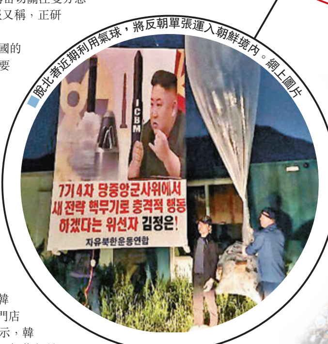
脫北者近利用氣球，將反朝傳單張連入朝鮮境內。網上圖片