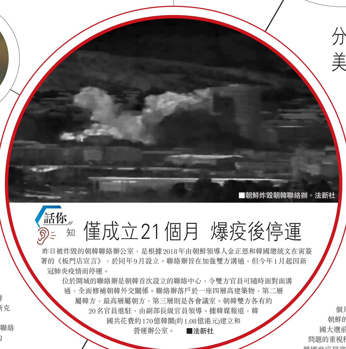
朝鮮炸毀朝韓聯絡辦。