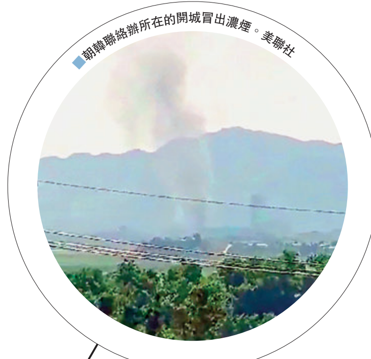
朝韓聯絡辦所在的開城冒出濃煙。

朝鮮與韓國關係急轉直下，為抗議韓國縱容脫北者越境散發反朝傳單，朝鮮昨日下午炸毀位於開城的朝韓聯絡辦公室，宣稱這是為了讓「人渣」和默許「人渣行為」的人付出應有代價。韓國政府事後立即召開國家安全保障會議商討對策，青瓦台對朝方舉動深表遺憾，表示若朝鮮繼續令半島局勢惡化，韓方將採取相應的強力措施加以應對。