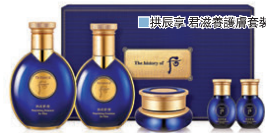
拱辰享君滋養護膚套裝

每位爸爸都一直為家庭默默付出，臉上也開始出現肌膚鬆弛、皺紋及膚色暗啞等等的歲月的痕跡！今個星期日就是父親節了，想爸爸保持年輕肌膚，每天都煥發光彩？大家不妨考慮送上一些男士護膚品及香水。