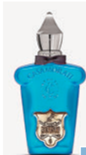
Mefisto Gentiluomo 香水

在男士香水方面，可選 Xerjoff 的 Mefisto Gentiluomo 香水，它以佛手柑與檸檬作為前調，清新的果香勾勒出男性的清冽，主調以玫瑰和鸚尾花作為主角，富有魅力的香氣為爸爸增添一份潔淨優雅的氣質，尾調加上琥珀和雪松木，獨特的木調香氣盡顯男性成熟魅力。