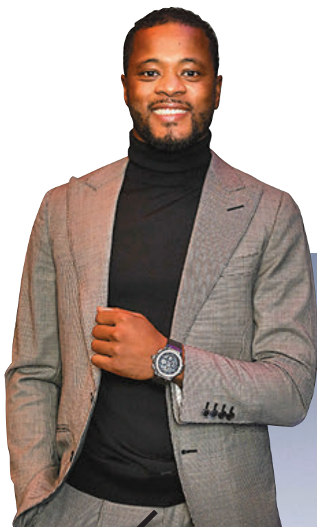
HUBLOT Classic Fusion Special Edition 「London」腕錶

父愛重如山，作為一家之主的爸爸，無論順境逆境，他一直以來默默地守護着家庭。今年，不同品牌精挑細選了多款不同風格、不同造型的腕錶及配飾，讓大家不用四處尋覓，都可以向你心目中的英雄爸爸送上型格十足、動靜皆宜的腕錶及配飾，感激他的辛勞和無私付出，為他打造潮爸造型。