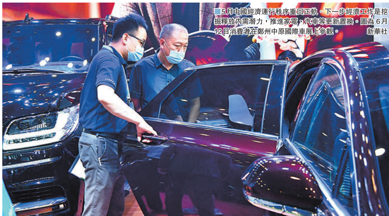
5月中國經濟運行秩序重回正軌。下一步經濟工作是挖掘釋放內需潛力,推進家電、汽車等更新置換。圖為6月12日消費者在鄭州中原國際車展上參觀。

香港文匯報訊(記者 海巖 北京報道)在新冠疫情防控制態化及穩增長政策加碼的支持下,國家發改委新聞發言人孟瑋昨日在例行發布會上表示,「5月中國經濟運行秩序重回正軌。」不過,孟瑋強調,全球疫情和世界經濟形勢依然複雜嚴峻,內地散發病例依然存在。下一步經濟工作首要是大力挖掘釋放內需潛力,積極推進家電、汽車等更新置換和回收處理,順勢而為促進消費新業態加快發展。