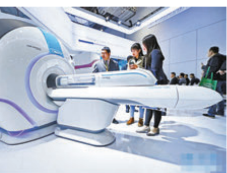
去年進博會醫療器械及醫藥保健展區。

此外,中國國際進口博覽局還公布了新一批參展商名單,從3月至今,該局已陸續公布了四批參展企業名單,大部分是世界500強、行業龍頭企業等。