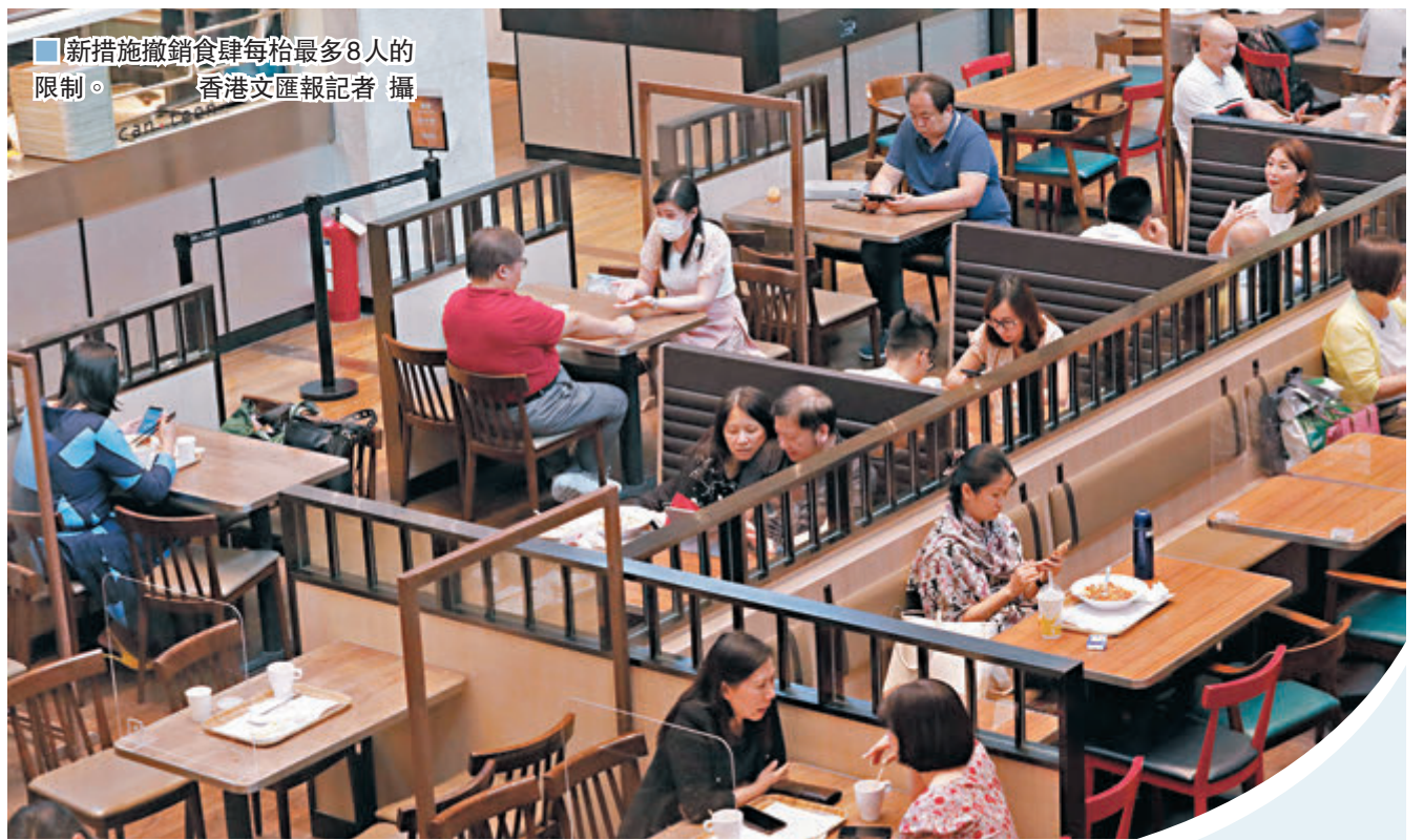
新措施撤銷食肆每枱最多8人的限制。

陳肇始昨日在記者會上指出,新冠病毒在無有效療法及疫苗前不會完全消失,故政府需把防疫和管理感染的工作納入社會日常運作的新常態中。政府一直採取張弛有度的策略,平衡保障公共衛生、經濟影響及社會接受程度等因素,讓社會逐步恢復正常運作,近日考慮公共衛生風險後,決定放寬限聚令等。