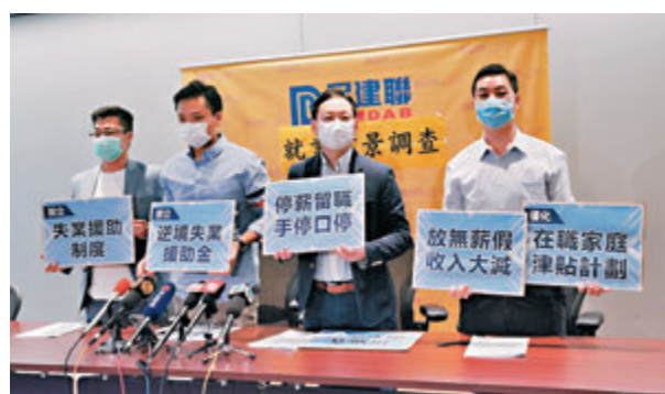
民建聯調查顯示，74%失業人士「無信心」在半年內找到工作。