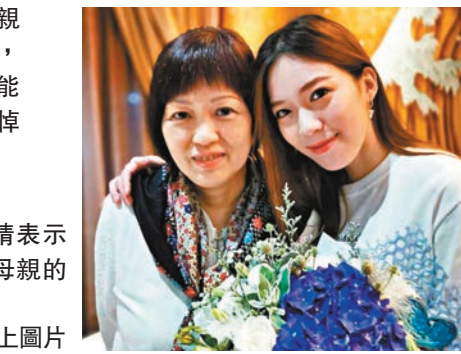
▲黃芷晴表示會惦記母親的美好！網上圖片