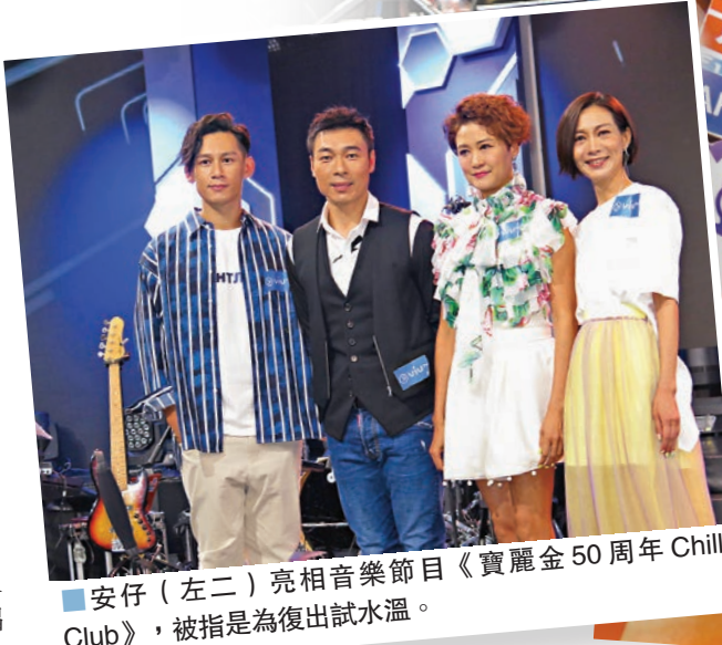
▲安仔（左二）亮相音樂節目《寶麗金50周年 Chill Club》，被指是為復出試水溫。