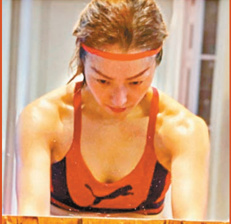
▲Sammi努力做運動Keep Fit。網上圖片

香港文匯報訊（記者李思穎）鄭秀文（Sammi）在老公許志安「偷食」事件後，她選擇了原諒對方，並陪伴着安仔度過這一關，據知Sammi對安仔這次復出，予以無限支持，為老公加油！