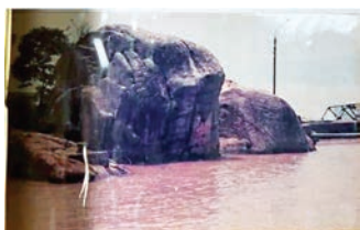
■奇石——南宋少帝與丞相陸秀夫殉難處是市級重點文物保護單位。

會的原名稱！同時那位酒店經理更告知我也認識酒店附近恰巧也有一條村的人是姓「溫」的，於是便馬上致電該村朋友，告知有一位姓「溫」的香港人到訪，並告知其香港的鄉村也是來自崗州的。 不到1小時，那條村的溫姓代表已來到酒店，一談之下，正是他鄉巧遇故知，我本來只是打算協助香港年輕人來新會，不料自己因而找到了自己的先祖在內地發源之地——新會，又名崗州，因此，我更有信心，可以為自己的大埔仔村透過新會而追尋本村溫姓的根源了。 既然要認祖歸宗，當然便要在村內組團前往新會，特別是在重陽節之前，參加新會重陽祭祖活動，1997年至今，轉眼已是23年了，幸而在各地溫姓兄弟同心協力之下，除了將先祖祖墓重修之外，並訂定每年農曆九月初一為前往新會為先祖掃墓之日，每年參加人數也愈來愈多。廣東省及內地溫姓人士，特別是馬來西亞溫姓華僑，也有前來參拜！ 這座古墓面向新會內海，對面海旁卻正是南宋少帝與丞相陸秀夫殉難之處！