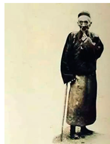
怪老頭戴指痛罵真洋鬼子。

沒課上時，一班教員齊集休息室，海闊天空，大話西遊。其中有一人，由美歸來，頭頂不知多少個學位，年少得志的才俊。