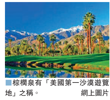
棕櫚泉有「美國第一沙漠遊覽地」之稱。網上圖片

你是天生的尤物 你是永恆的精靈 你寄託了芸芸眾生的欲望 你刺痛了每一顆癡情的心 歷經塵世的苦難和喧囂 你絕塵而去 不留下一片影