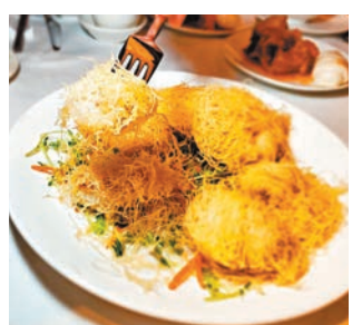
■金絲鵝肝百花炸釀北海道帶子