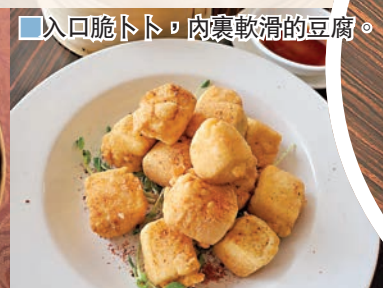
■入口脆卜卜，肉裏軟滑的豆腐