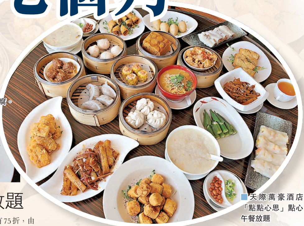
■天際萬豪酒店「點點心思」點心午餐放題