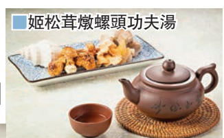
■姬松茸燉螺頭功夫湯