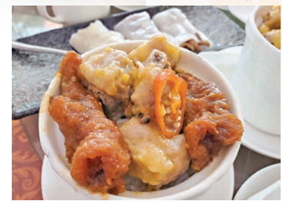
■熱辣辣的蒸飯，令人一再回味