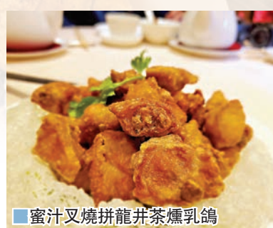
■蜜汁叉燒拼龍井茶燻乳鴿