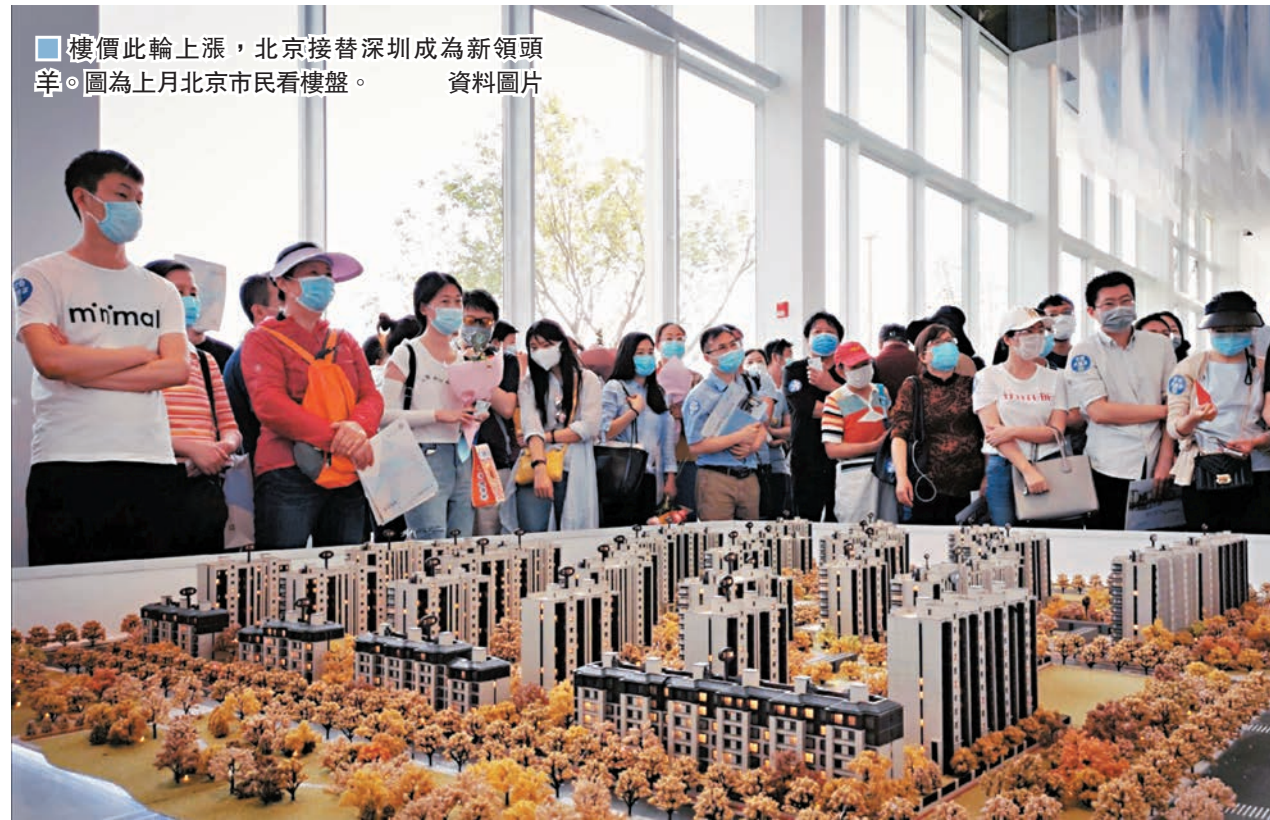
樓價此輪上漲，北京接替深圳成為新領頭羊。圖為上月北京市民看樓盤。資料圖片

香港文匯報訊（記者 海巖 北京報導）5月內地樓市持續回暖，國家統計局昨日公布70個大中城市商品住宅銷售價格變動情況顯示，5月，一二三線城市的新建商品住宅、二手住宅價格均環比上漲，一線城市房價全面上漲，北京接替深圳，成房價上漲新的「領頭羊」。