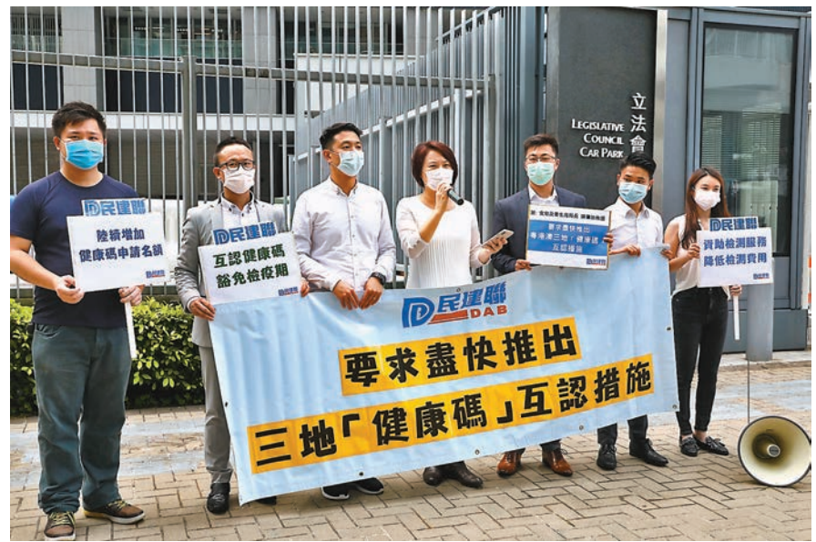
民建聯促請政府盡快推出三地健康碼互認措施。