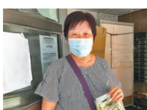
陳女士表示，遞交樣本能為自己買個安心。

煩，認為是作為公民的分內事，但透露大廈內部分居民不負責任，早前衛生防護中心及警方上門向居民派發樣本收集瓶時，有居民不肯開門領取，「他們的行為非常自私，如果他們是隱形帶菌者，我們整座大廈『多得佢哋唔少』。」自疫情爆發以來，她已非常注意個人及家居衛生，現在更會每天用稀釋漂白水清潔地板，出外亦會帶備更多個人清潔用品。