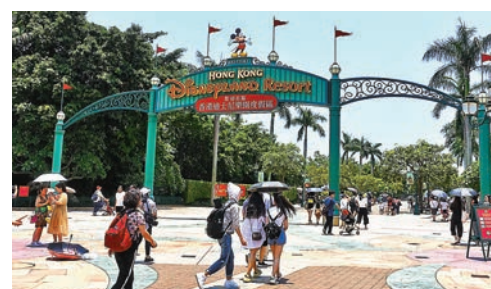
迪士尼樂園。資料圖片

另外，旅遊局總幹事程鼎一昨日在一個電台節目上表示，受疫情影響，料即使日後逐步恢復關口服務，訪港旅客量亦會較最高峰跌逾半，且旅遊業亦會轉由商務、短途為主，因此旅遊局會加強推動本地旅遊。他續說，現時酒店轉型尤其明顯，有酒店推廣兩三晚親子服務套餐，安排小朋友上興趣班，爸爸媽媽可健身、享用水療等。