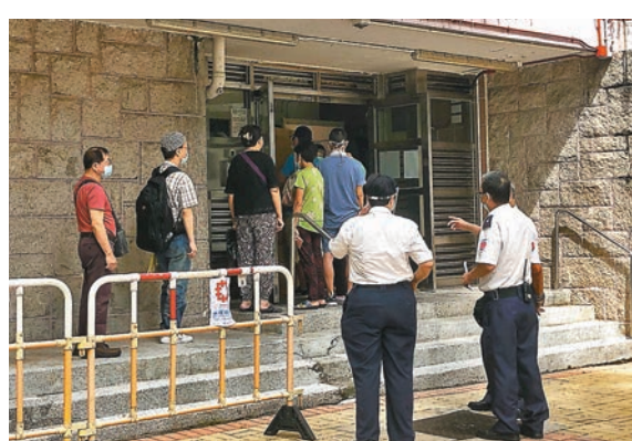
衛生防護中心職員定時清潔綠泉樓大堂範圍。

昨晨8時起，衛生署人員在綠泉樓大堂收集樣本瓶，居民準時手持裝有一家幾口樣本的塑料袋，在大堂輪流遞交樣本瓶，其間有身穿藍色保護衣的衛生防護中心職員定時清潔大堂。約中午12時，工作人員完成收集樣本工作，樣本用黑膠袋盛載，由數名員工帶上車。居民梁女士表示，對於衛生防護中心再次收集居民的深喉唾液樣本不感到麻