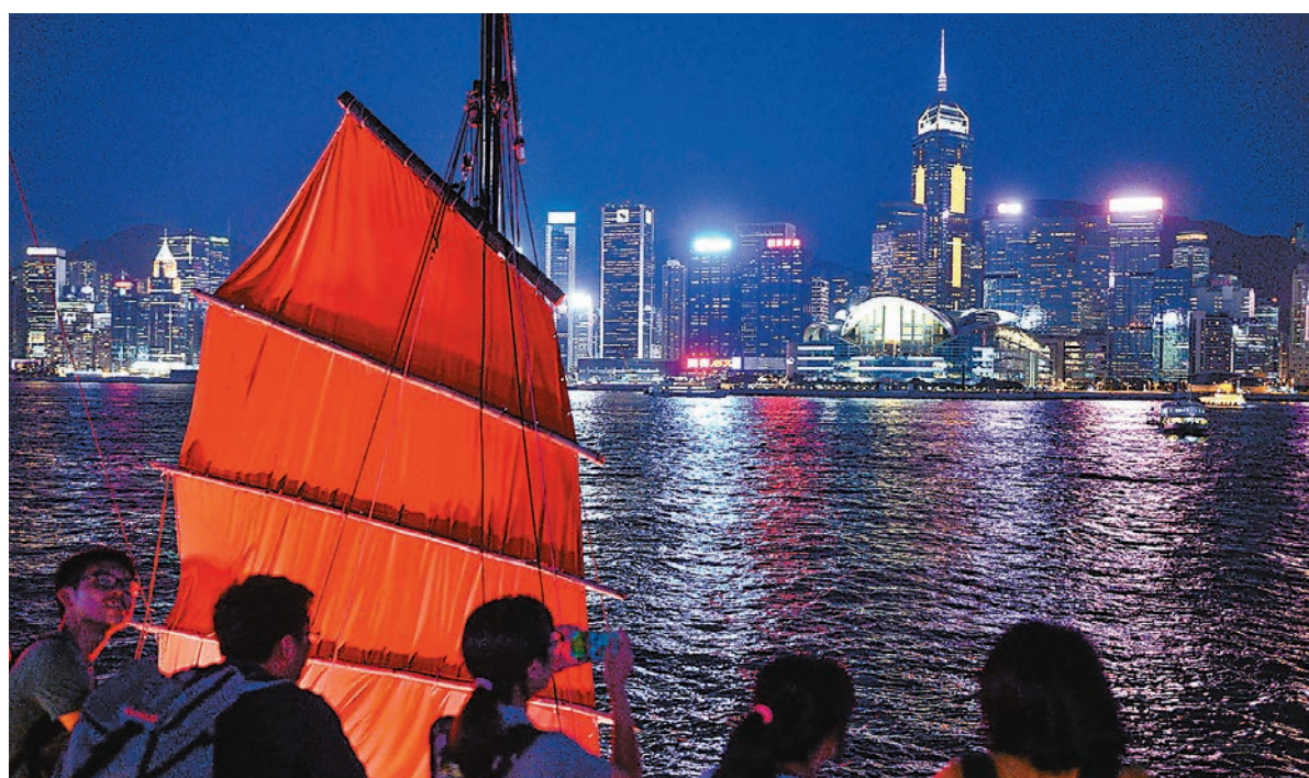
本港旅遊業在疫情下嚴重受挫，旅遊局推出計劃振興本地遊。

他表示，旅遊局復甦旅遊業的整體策略會由本地做起，鼓勵香港人在港旅遊，其中「旅遊，就在香港」計劃便於昨日正式推出。他指出，該計劃獲旅遊、零售及餐飲業界大力支持，攜手刺激消費，旅遊局亦希望藉此讓業界為日