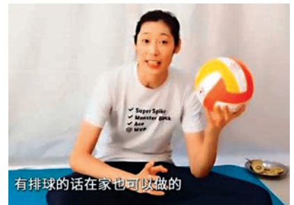
朱婷教導球迷用排球也可做的運動。網上截圖

常生活的點滴，早上起床後她還親手做了奶昔帶去訓練。而在訓練完畢後，朱婷在休息時間仍是會做一些和排球相關的運動。