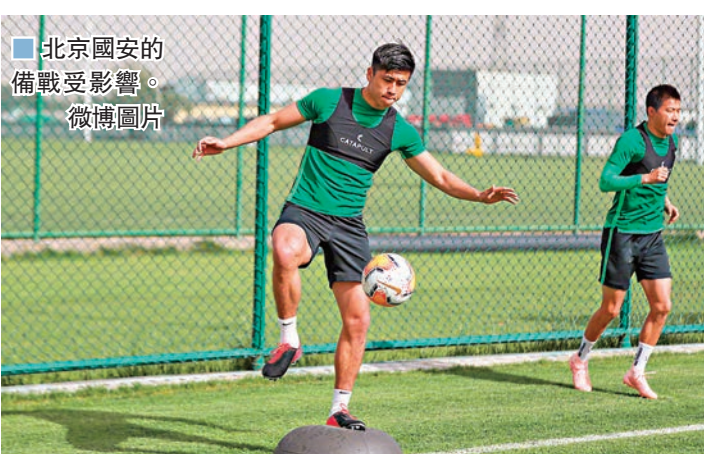
北京國安的備戰受影響。微博圖片