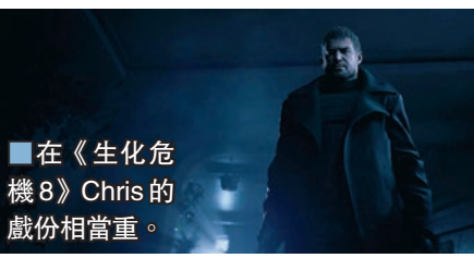
■ 在《生化危機 8》Chris 的戲份相當重。

der-Man: Miles Morales》及有趣 3D 動作遊戲《Ratchet & Clank: Rift Apart》、Guerrilla Games 巨製《地平線 2》、PS3 名作《Demon's Souls》的重製版等。教人意外是 Capcom 突然發表《生化危機》系列第 8 集《Village: Biohazard》，和前作一樣都是以主觀視點操作，Ethan 跟歷代名角 Chris 會擦出許多火花，預定明年發售，該廠亦宣佈後年推出題材獨特的另一新作《Pragmata》。