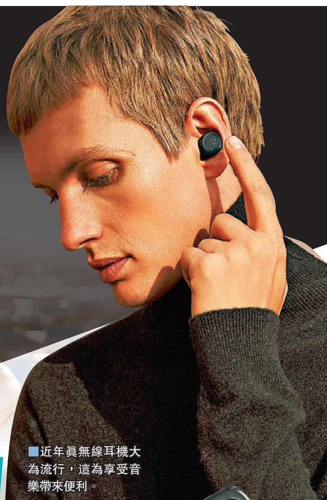
■ 近年真無線耳機大為流行，這為享受音樂帶來便利。