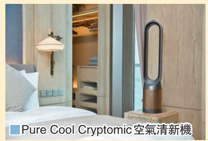
■ Pure Cool Cryptomic 空氣清新機