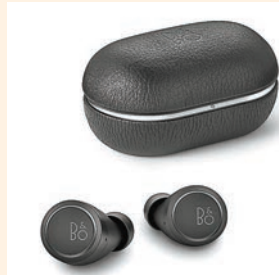
■ Beoplay E8 第三代

Bang & Olufsen 全新升級版 Beoplay E8 第三代，專門為追求真無線耳機的自由便捷，並且注重卓越音質和優雅設計的用户而打造，這款高雅而奢華的新耳機不僅延續了品牌標誌性音效和精湛工藝，也在上一代的基礎上進行了一系列的升級。第三代外形小巧，佩戴舒適，在顯著提升通話質素的同時，其電池性能亦得到強化，設置更簡單，操作更方便。