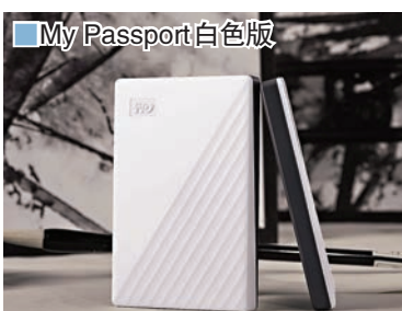
■ My Passport 白色版

Western Digital 旗下 WD My Passport 便攜式流動硬碟系列於去年 IFA 發布後，其色彩奪目和輕薄設計獲得用家歡迎。日前，品牌加推 My Passport 白色新款，讓用戶能夠儲存大量照片、影片、音樂和文件之餘，亦不忘增添生活色彩，按喜好配襯電腦的顏色。