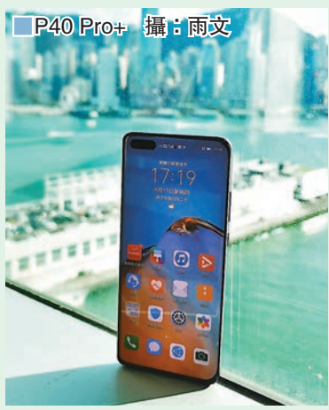
■ P40 Pro+

今年是5G手機陸續推出的一年，為了讓爸爸追上潮流，為他送上一部全新的5G手機也是不錯的選擇。