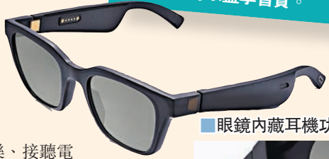
■ 眼鏡內藏耳機功能

看似是太陽眼鏡，其實內藏了無線耳機，這副 BOSE Frames 可給爸爸全方位的視聽新體驗。它配有品牌輕巧的聲學系統，採用品牌獨家開放式設計，可讓爸爸在沐浴陽光、欣賞美景的同時，自在享受音樂、接聽電話及使用語音助手，適合喜歡音樂兼時尚的爸爸們。如果爸爸們的形象較多變，你更可選購兩款可替換鏡片，隨造型和心情設計專屬的 BOSE 眼鏡，同時減少眩光問題。