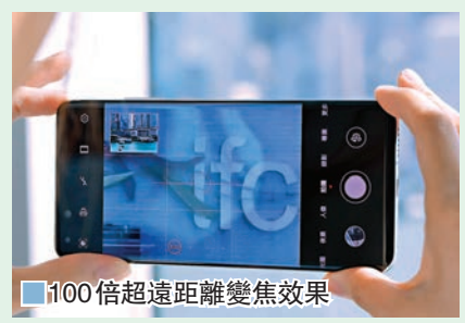
■ 100倍超遠距離變焦效果