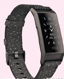
■ Fitbit Charge 4 特別版

Fitbit Charge 4 配備品牌先進的感應器，現支援內置 GPS 和 Spotify 應用程式等功能組合，提供健康和健身追蹤器功能，更具備基本的智慧功能，電池續航時間長達 7 天，更配以游泳防水設計。Charge 4 搭載了創新的健康與健身指標