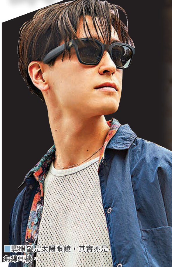
■ 驟眼望是太陽眼鏡，其實亦是無線耳機。

今個星期日(21日)就是父親節了，雖然現在疫情暫見緩和，但大家依然不要掉以輕心，如不外出吃大餐，你會怎樣慰勞爸爸？其實，自疫情後，坊間多了不少購物網店，讓爸爸不外出也能選購心頭好。若你的爸爸熱愛智能生活潮物，作為子女，可因應爸爸的喜好，為他送上一份適合他的科技潮流產品，讓他享受科技帶來的生活樂趣。