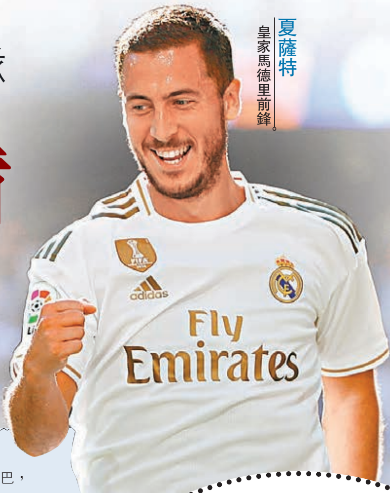
夏薩特 皇家馬德里前鋒