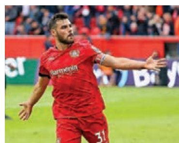
利華古遜首席射手禾蘭傷癒復出。新華社