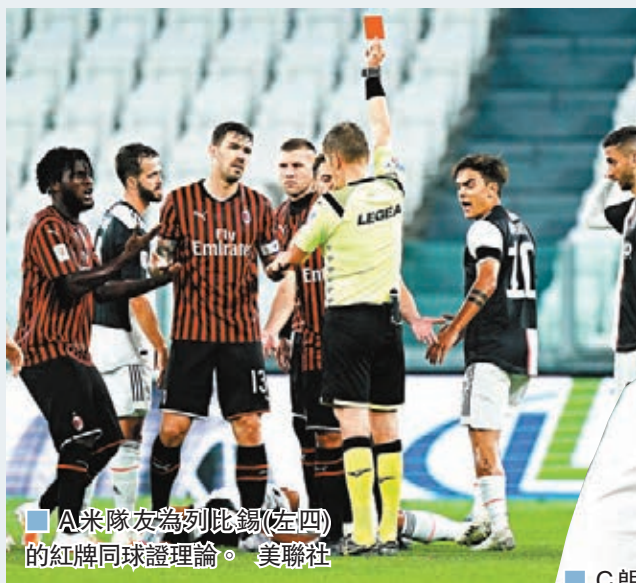
A米隊友為列錫(左四)的紅牌回球證理論。

最終祖記憑藉首回合1:1的作客入球優勢晉級，將在決賽對陣拿波里或國際米蘭。祖記老門神保方表示，足球的回歸對於整個國家都非常重要，他說：「這對每個人來說都是非常困難的一段時期，我們都不知所措。足球會激勵整個國家的精神狀態，我認為比賽的重啟對於意大利非常重要。」 ■新華社