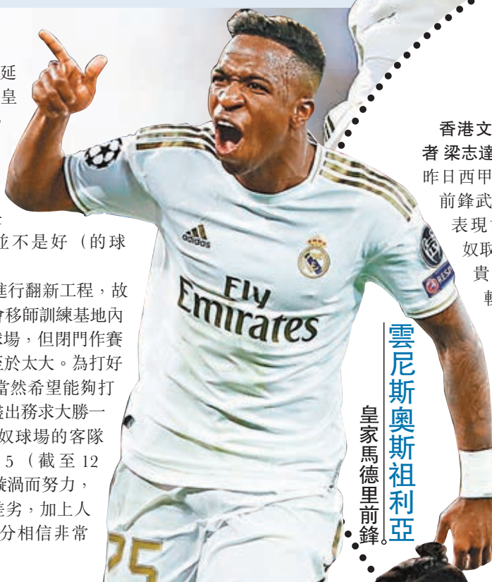
雲尼斯奧斯祖利亞 皇家馬德里前鋒