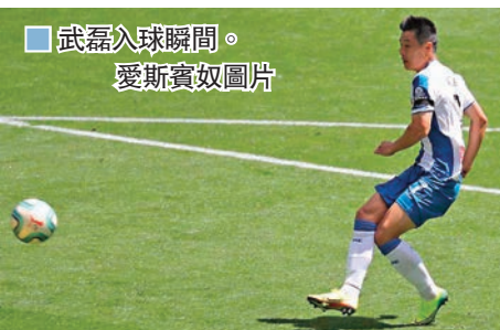
武磊入球瞬間。

13日凌晨主場出戰利雲特，華倫西亞上半場接連中欄中柱，換邊後，縱使對方打少一人仍遲遲無法打開缺口，直至89分鐘才由洛迪高摩爾奴勁射打破僵局。滿以為絕殺在望，卻被利雲特在補時第8分鐘憑藉射入12碼扳平1:1，華倫西亞結果遺憾地只得1分，錯過升上前六名的歐洲賽區域機會。