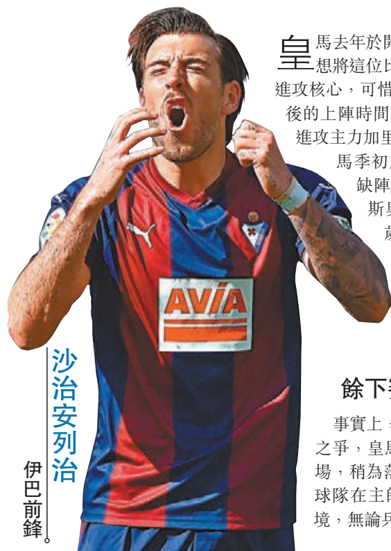
沙治安列治 伊巴前鋒

皇馬去年於開季前斥巨資收購夏薩特，本想將這位比利時國腳打造成球隊新一代進攻核心，可惜由於傷患問題，夏薩特加盟後的上陣時間不多，貢獻亦僅一般，另一進攻主力加里夫巴利又長期受傷，導致皇馬季初成績不穩。然而兩大球星的缺陣亦造就一眾新星彈起，雲尼斯奧斯與洛迪高兩名還未滿20歲的小將獲得施丹重用，進步神速，中場費達歷高華維迪的演出亦漸見大將之風，而今加上夏薩特的復出，皇馬有充足的兵源去應付復賽後的密集賽程。