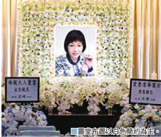
靈堂布置以白色簡約為主。