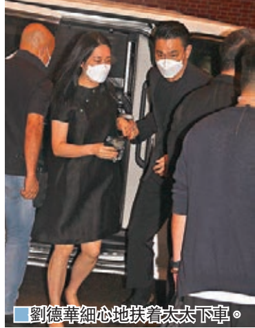
劉德華細心地扶着太太下車。

媒體上載他們以往的工作片段，令他有不少回憶，也慨嘆時間過得很快，一轉眼就40年。