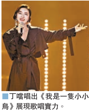
丁噹唱出《我是一隻小小鳥》展現歌唱實力。

其實丁噹也是在節目播出後才得知低分的理由，她在微博發文，表示從小到大參加過很多次比賽，當然不可能每次都贏，輸的時候會告訴自己還不夠優秀，下次一定要做得更好，但當她聽到獲低分的理由竟然是「唱得太好了」，她和觀眾姐妹們一樣也是滿臉問號，她亦直接標記評審杜華。丁噹發文短短一天獲過百萬個讚，並得到網友留言力挺「你是很棒的歌手」。