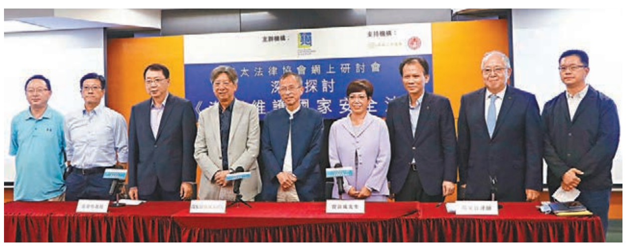
亞太法律協會舉行港區國安法網上研討會。