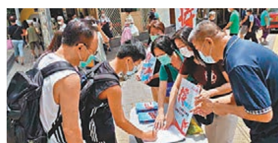
▲大批市民踴躍簽名表示支持。