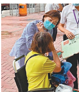
▲梁美芬落力向市民宣傳。