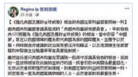
▲葉劉淑儀在fb指，中央政府必然會採取強烈反制措施。