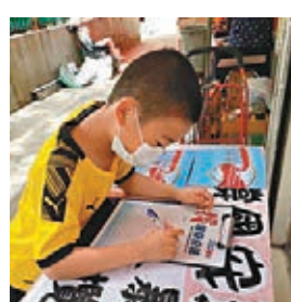
▲小朋友簽名支持立法。